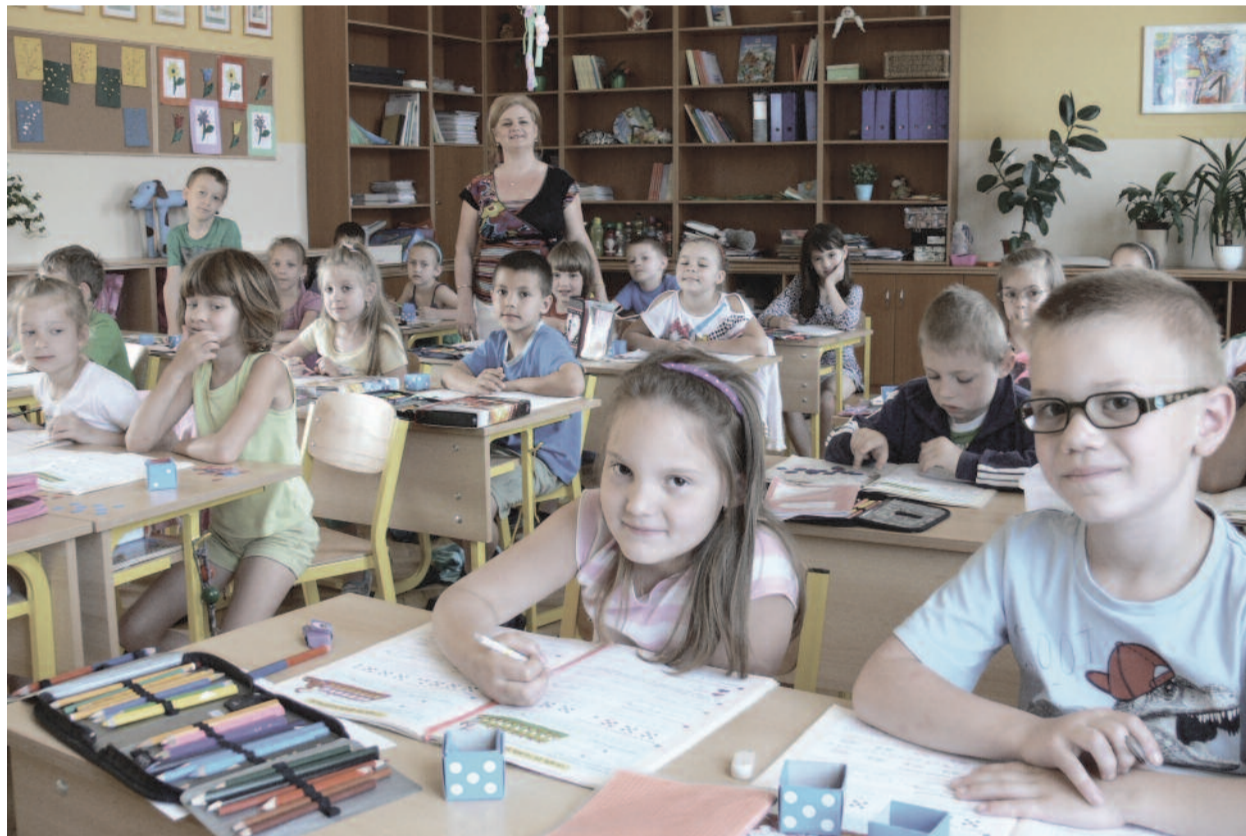
Újabb két első osztályban ötvenkét gyermek kezd meg tanulmányait szeptemberben Békéscsabán. A felvételen a mostani 1/b osztály tanulói.