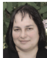
Evangélikus istentisztelet a Magyar Rádióban

A gyülekezet új közössége a férfikör, melynek tagjai havonta találkoznak. Évente három alkalommal újságot adnak ki Evangélikus Hírlevél címmel, mely a gyülekezet honlapján ( http://bakonycsernye.lutheran.hu/ ) is olvasható. A gyülekezet Élő Kövek Alapítványa hatékonyan segíti a településen zajló karitatív munkát.