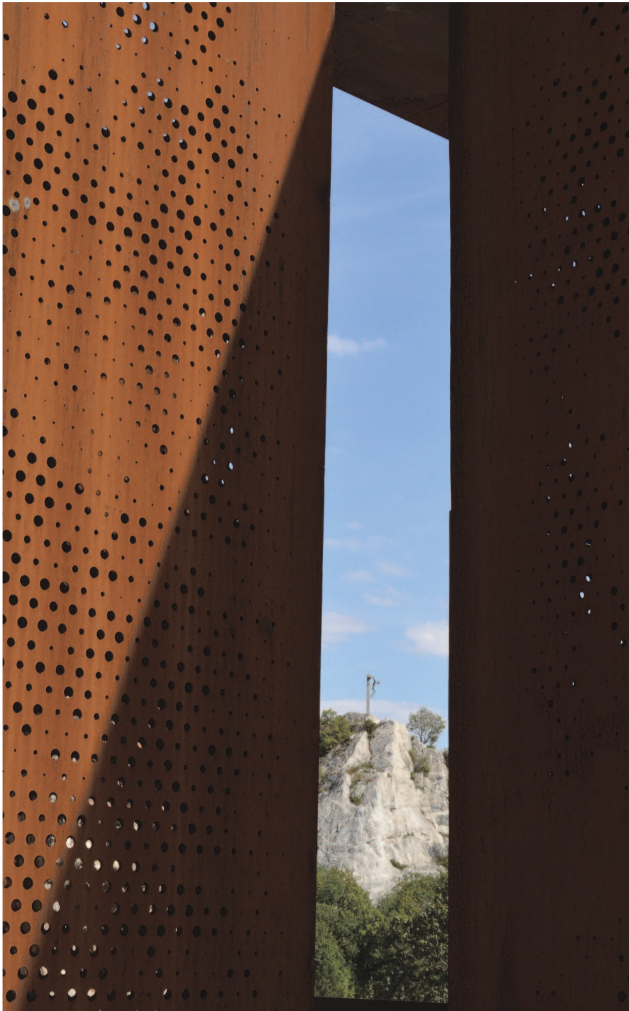
Rés nyílt vasbörtönünkön / Már csak emlék a tegnapelőtt.