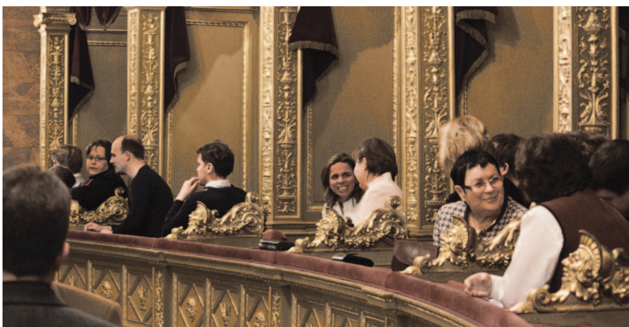
Evangélikus közönség az opraházi páholyokban