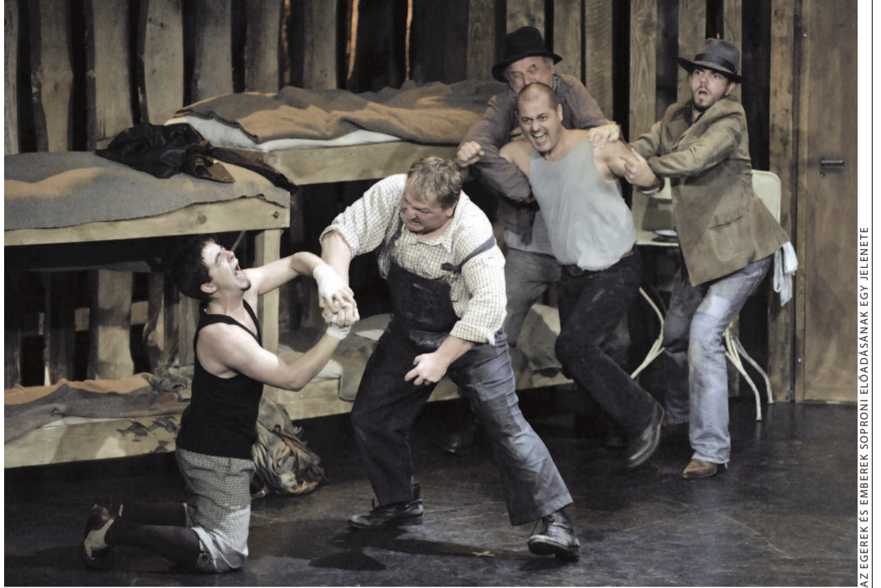
AZ EGEREK ÉS EMBEREK SOPRONI ELŐADÁSÁNAK EGY JELENETE

A szerző az EHE Gyakorlati Intézetének vezetője