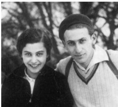
Gyarmati Fanni és Radnóti Miklós

Radnóti Miklós a kedvenc költőm, mivel nála ez az érzelmiség és a siker a helyzet abszurditásával párosul. A költő rettenetes élethelyzetben, a láger poklában írta meg csodálatos szerelmes verseit. Ezek közül a Bori notesz egyik darabja, a Hetedik ecloga a ked-