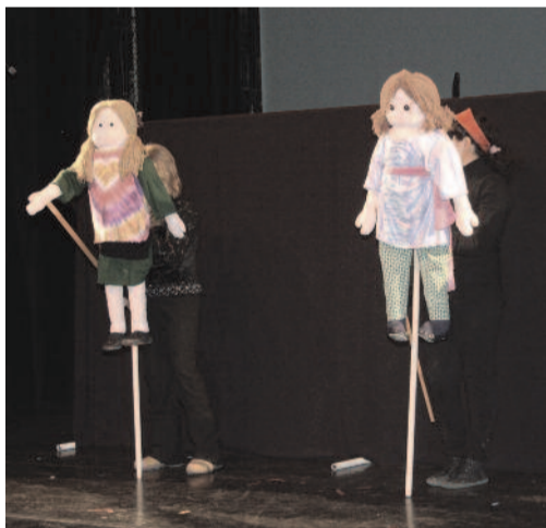
Toleranciára tanító óriás babák