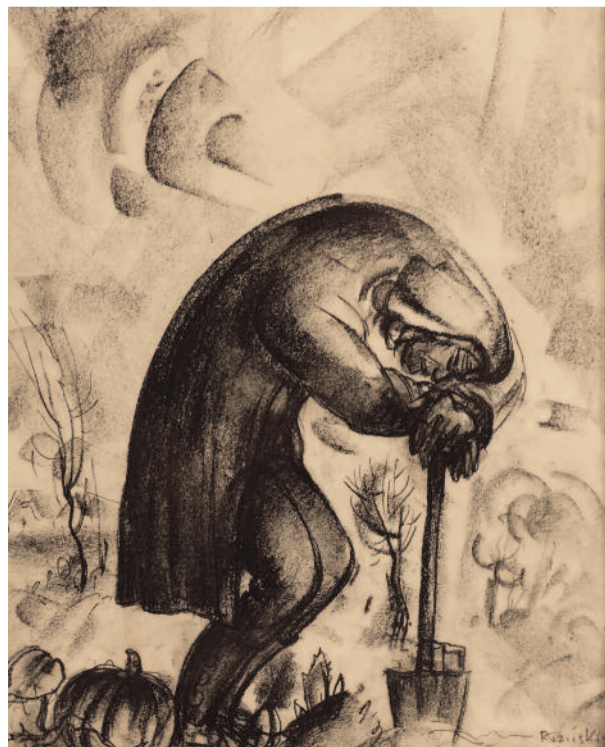
A megfáradt Tessedik