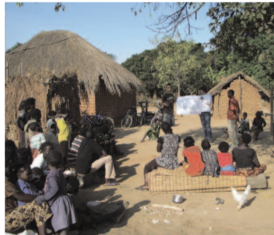
Iskola-előkészítő foglalkozás az egyik bemba faluban

bembáknál teljesítettek szolgálatot, akik nagy szeretettel, szinte már rajongással fogadták a fehéreket.