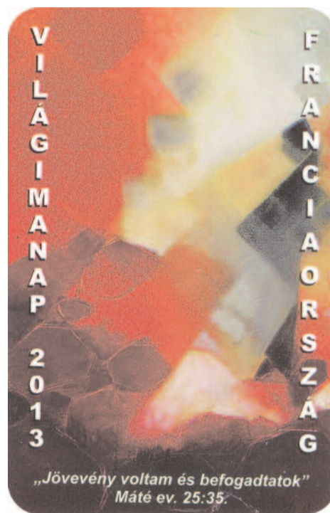
A világimanap alkalmából készült magyar kártyanaptár verzőja