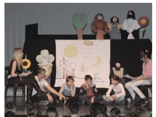
Bátónyterenyé-szúpatakiak csodálatos szövetsége