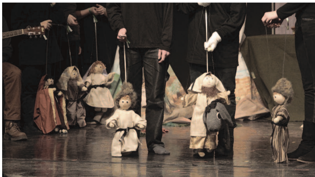
Büki bábok és bábozók

ké a sárga homokot. Az nem derült ki, hogy kiáltó szavakra – amely egyben a darab címe is: Legyen! – születtek-e a lények, vagy valami teremtési technikát is alkalmaztak a kis asztalkák gyurmázva. Mindenesetre – szájuk által vagy kezük alól – antilopok, oroszlánok, kígyók, békák bújtak elő. Nem csoda, hogy az interzív teremtőtevékenységet folytató gyermekek az alkotói öröm díját kapták a zsűritől.