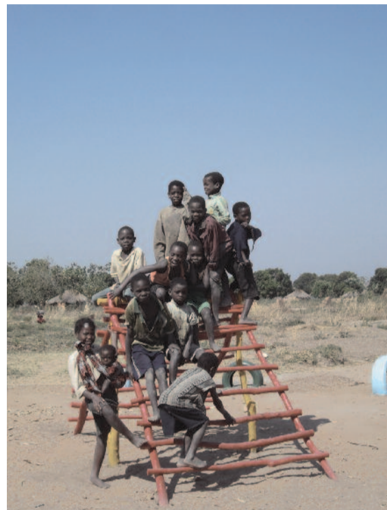
A három önkéntes fiatalember színes művét, a játszótéri mászókat boldogan vették birtokukba a bemba gyerekek

Márton elmondta, hogy az ország legnagyobb népcsoportjánál, a