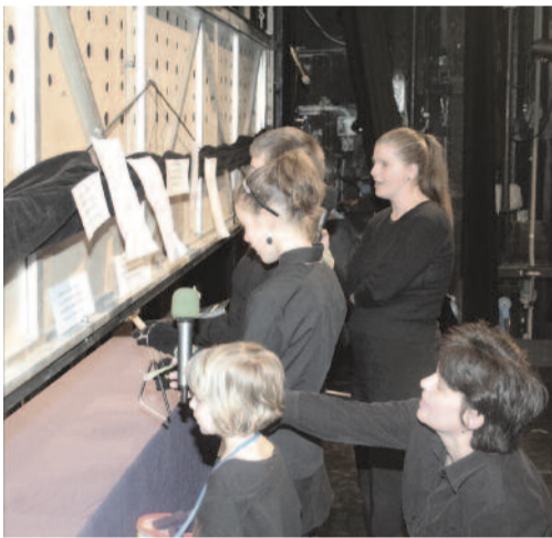
Zuglóiak a kulisszák mögött

tés nagyszerűségében még bajosan bízó „pajkos, engedetlen csacsi”, Csabi volt. A vidám szívek a gyermekközpontú előadás díját kapták.