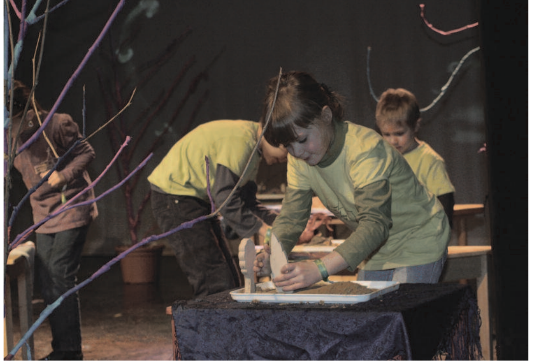
Elmélyült munka a „teremtőműhelyben”