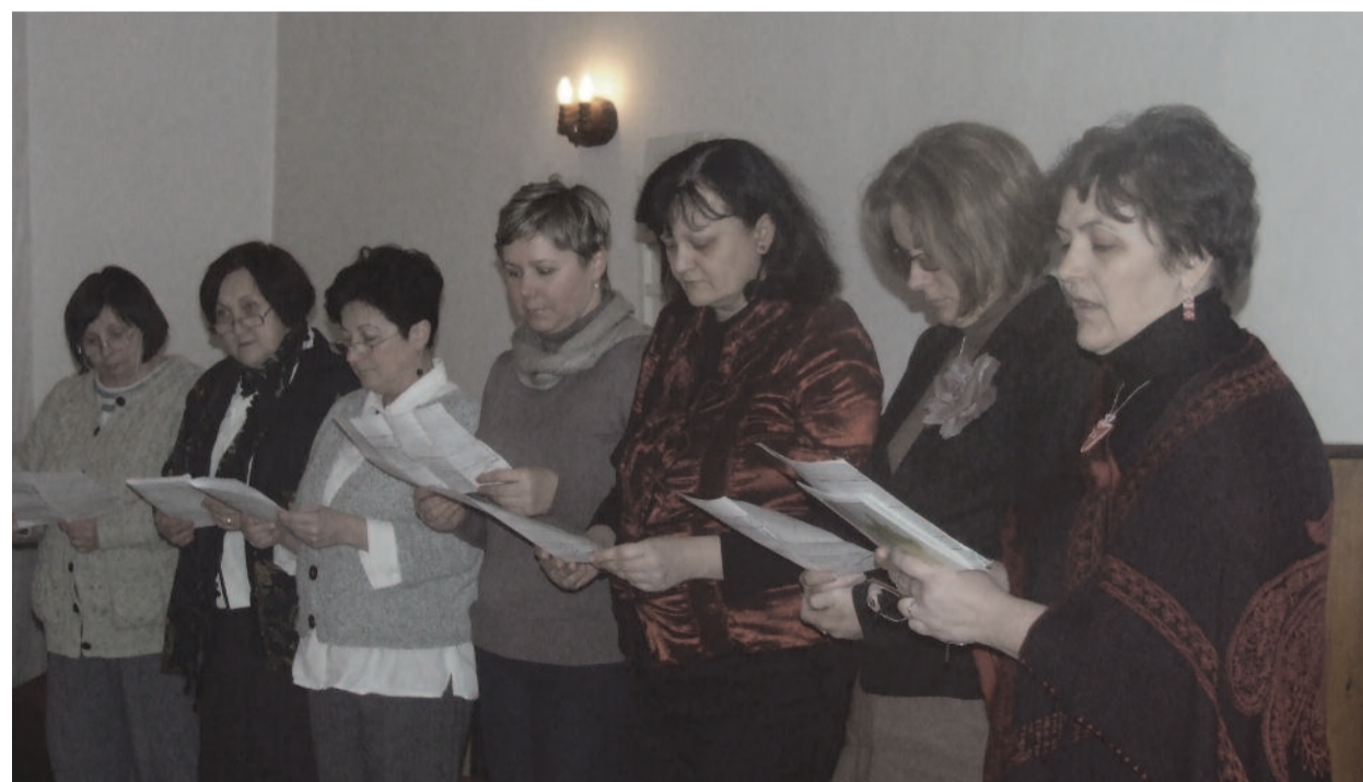
Az Alberti Evangélikus Általános Iskola pedagógusai olvassák a liturgiát