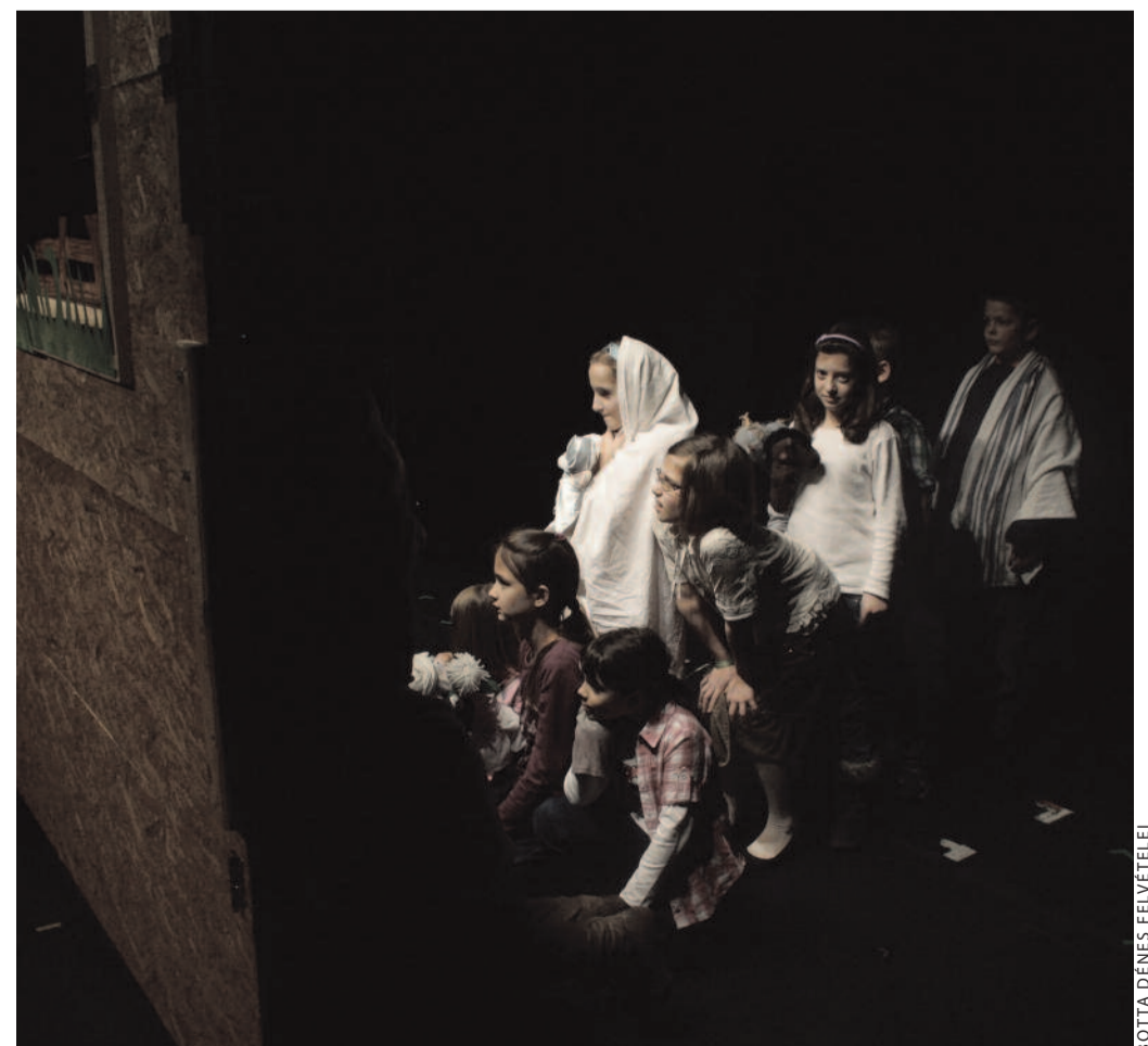
Csabi csacsi megvidámított szíve