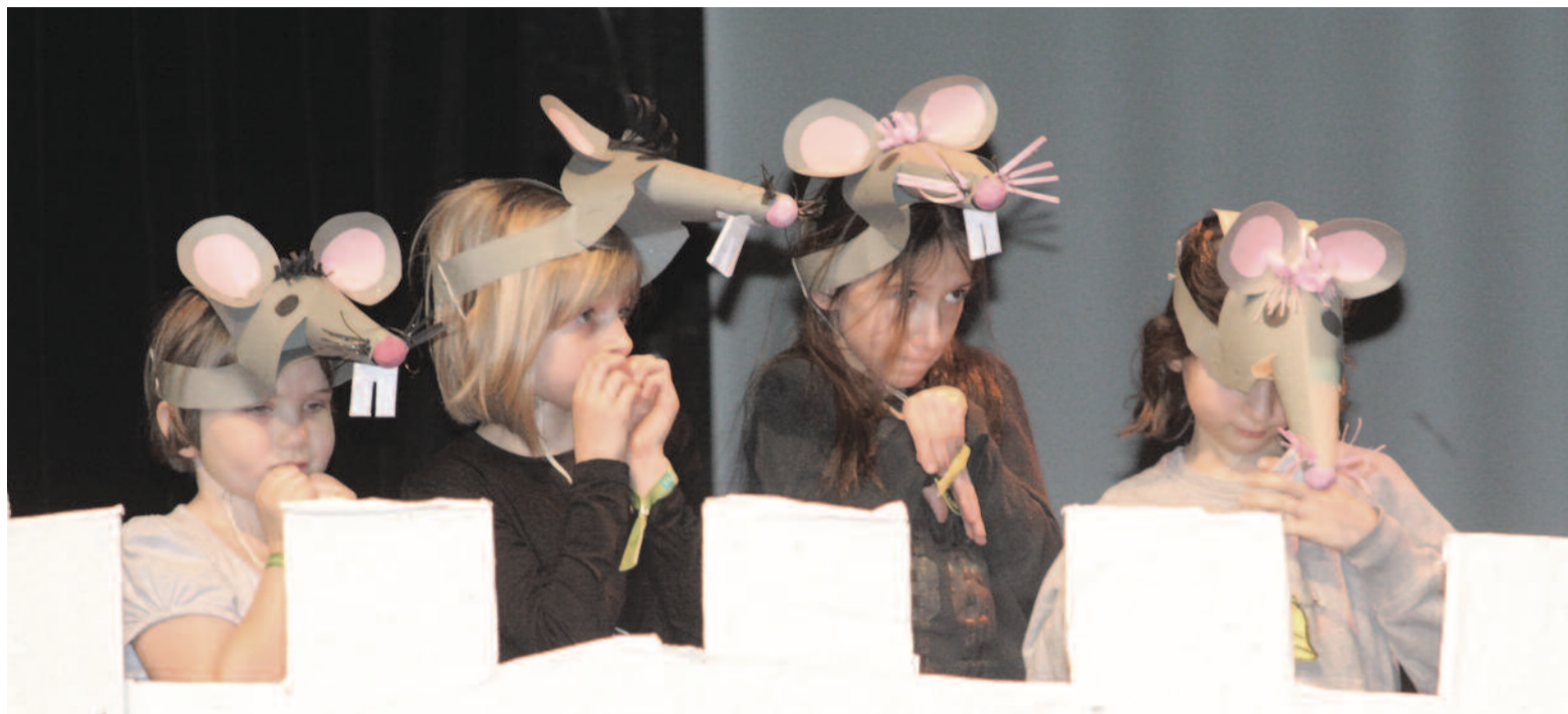
Nagytényi cincogók a macskagyökér nyomában