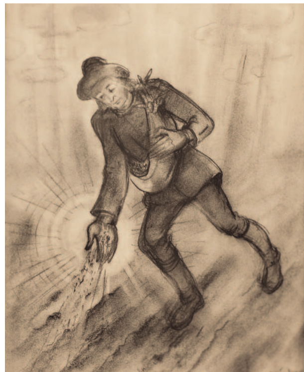
A magvető Tessedik