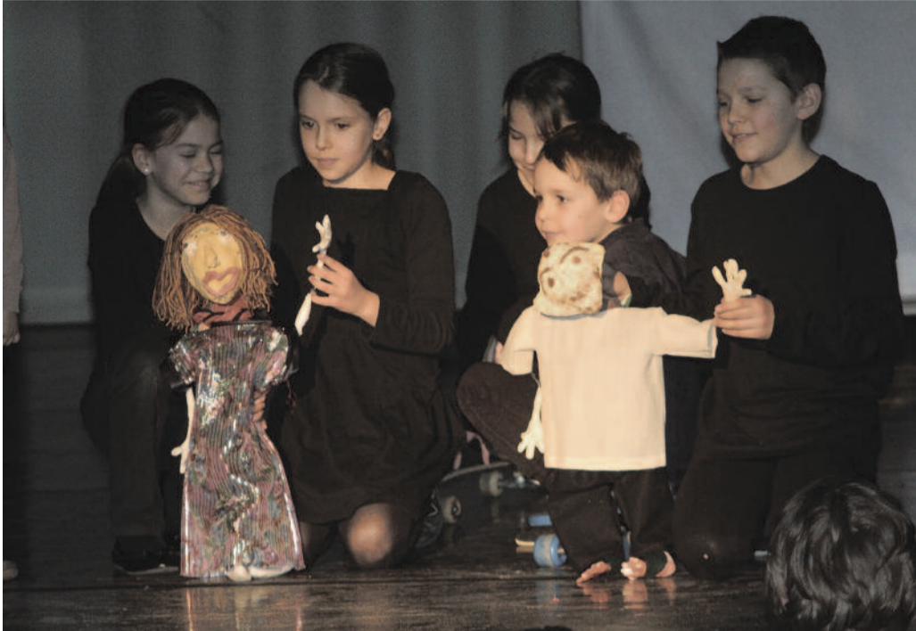
„Ádám, hol vagy?”