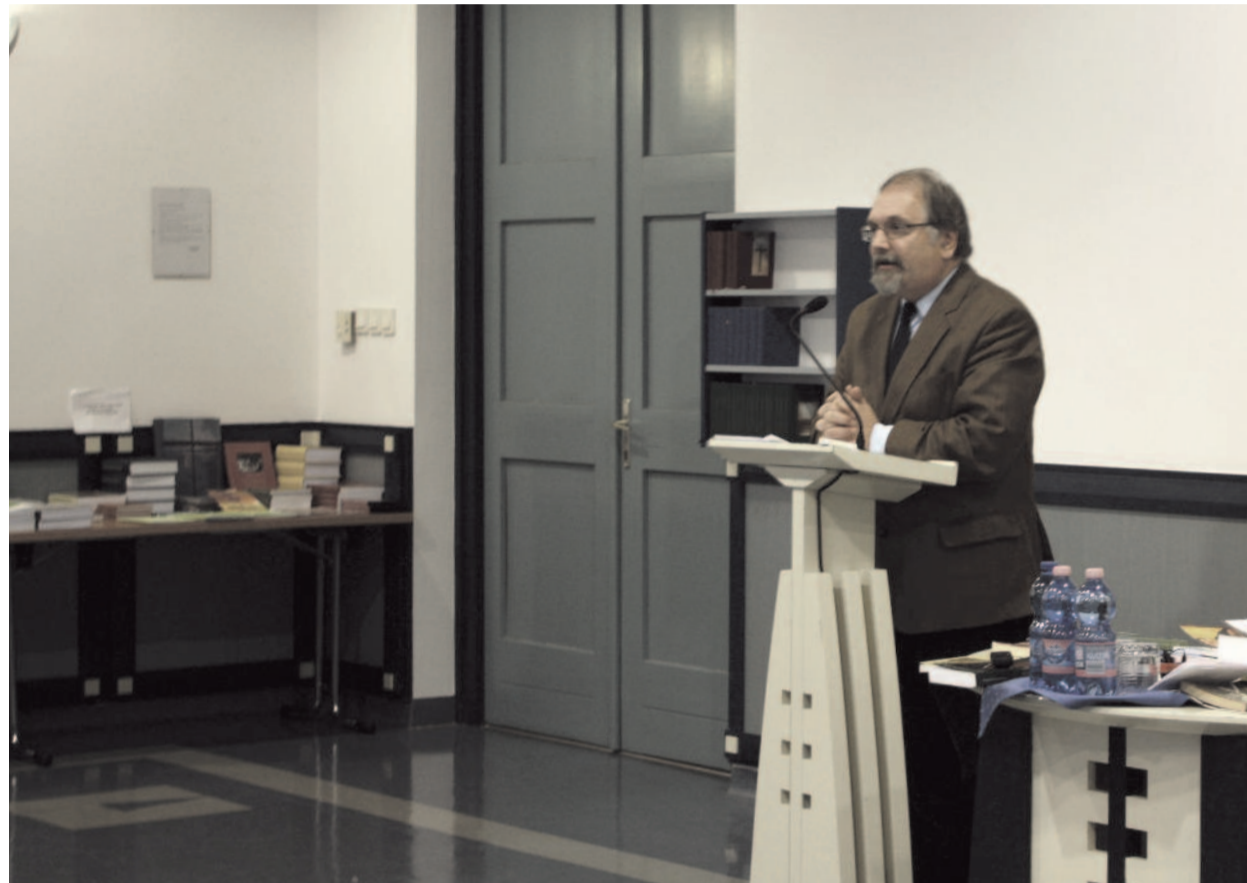
BALLA MARIA FELVÉTELE

cia minden alkalommal igehirdetéssel végződött. Az előadások anyaga először füzetként jelent meg, amely rendszeresen tartalmazta a hozzászólásokat is. E füzetek anyaga aztán négy vastkos kötetben látott napvilágot Encounters with Luther (Találkozások Lutherrel) címmel.