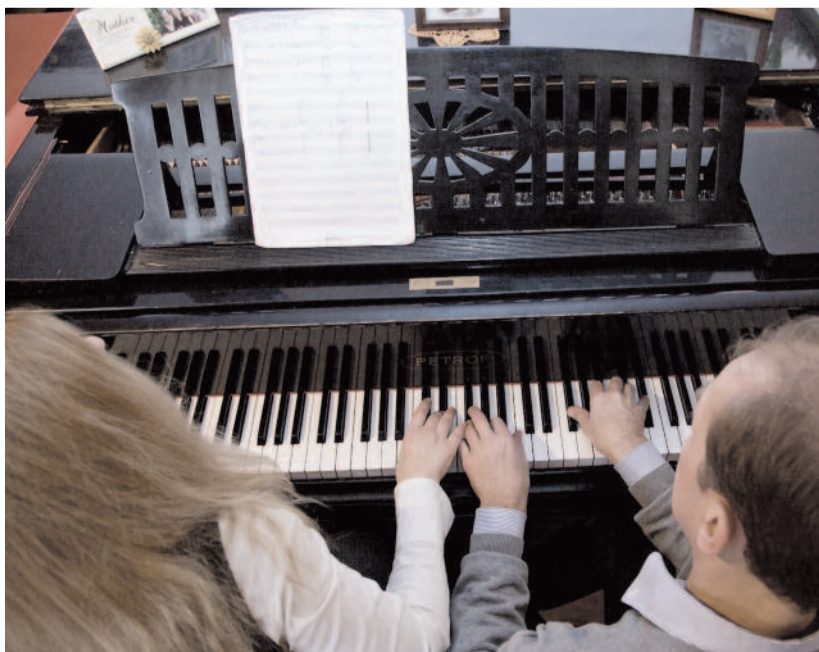
LUKÁCS GÁBRI FELVÉTELEI