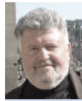
Evangélikus istentisztelet a Magyar Rádióban

Ami „szép és gyönyörűsége”, hogy az alkalom után nem rohanunk haza. Hosszú beszélgetések, megújuló iratmisszió, alkalmanként asztalközösség a folytatás.