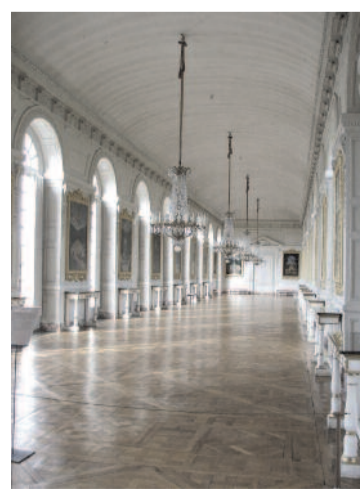
A Nagy Trianon-kastély belső tere