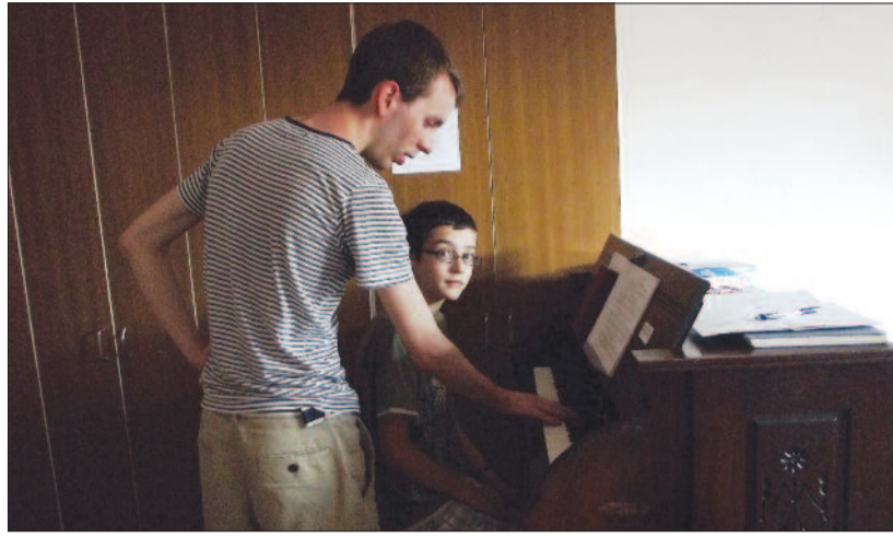
THURNAY VIOLA FELVÉTELEI

Vegyük sorra a címadó kérdés szavait, s pontosítsunk! A kántorképző nem tábor, hanem igazi tanfolyam, amely a tanulmányokra összpontosít. Ami táborjelleg megjelenik munkamódszereiben, az is mind az elmélyült zenei és lelki tanulás szolgálatára. S persze az ifjúság alkotja a résztvevők zömét, mégis úgy éljük meg évről évre, hogy felnőttek, „félntöttek” (az éppen végzősök és pályakezdők) és diákok egyetlen testvéri közösséggé érnek össze a tanfolyam ideje alatt. E lelki közösség pedig tudatosan vizsgálja Isten ígését. Küldetését ki-ki így értheti csak meg, s keresztyénként szeretnénk helyünket megtalálni a mulandóság és az örök élet összefüggésében is.