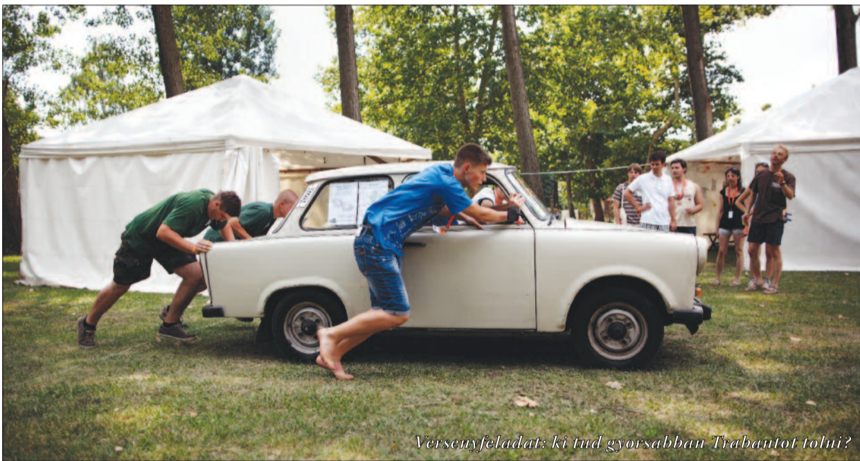
Versenyfeladat: ki tud gyorsabban Trabiantot tolni?