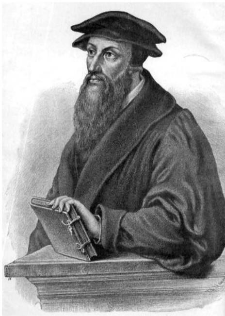
Kálvin János portréja

Kálvin a Római levélhez írott kommentárjának ( A rómaiakhoz írt levél magyarázata , 1539) előszavaként Grynaeushoz címzett.