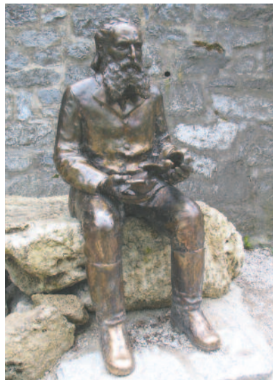
Herman Ottó szobra a Palotaszálló alatti függőkertben, Lillafüreden

Kutatásait Herman a Duna–Tisza közén, a Vajdaságban, Erdélyben, az Alföldön, Felvidéken és a Dunántúlon folytatta. Az összegyűjtött anyagot a bácskai Doroszlón rendszerezte. Az 1875-ben, 77-ben és 78-ban megjelent, háromkötetes, Magyarország pókfajánája című műve meghozta számára a világhírt. A könyvet egyébként saját kezűleg illusztrálta. Érdekesség, hogy a hiányzó magyar szaknyelvet a takácsipar és a szövés-fonás gyönyörű magyar kifejezéseivel pótolta.