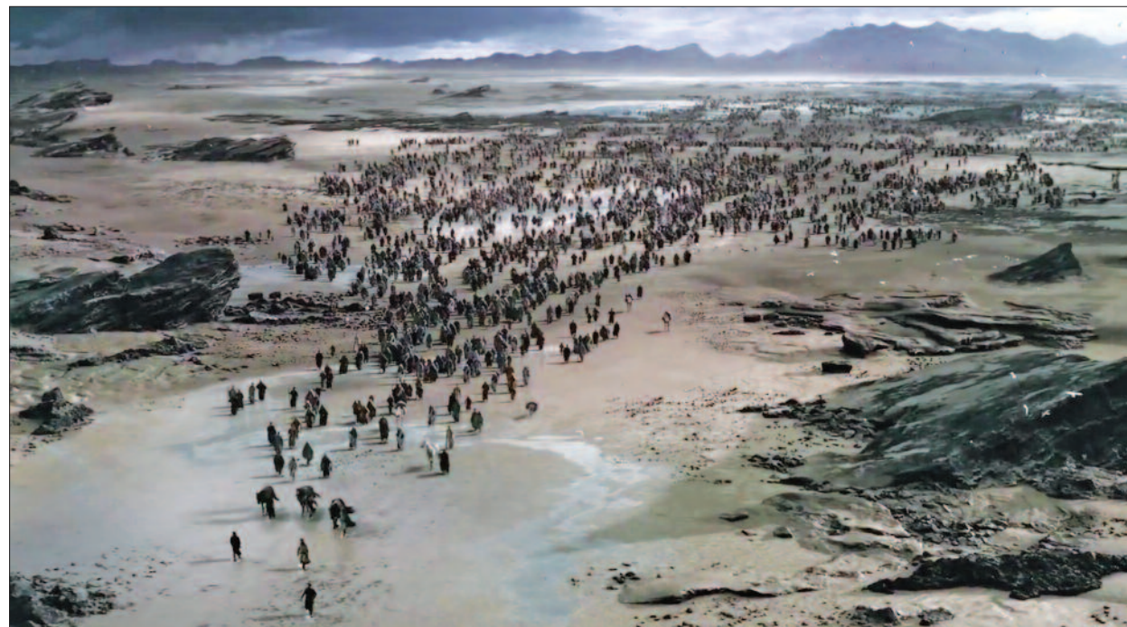
JELENETFOTÓ AZ EXODUS CÍMŰ FILMBŐL

A szerző megbízott püspökhelyettes, a Bács-Kiskun Egyházmegye esperese