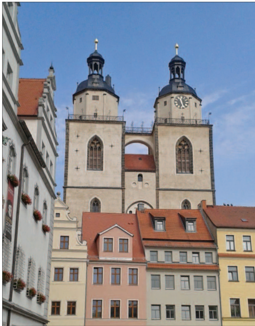
A városi templom Wittenbergben