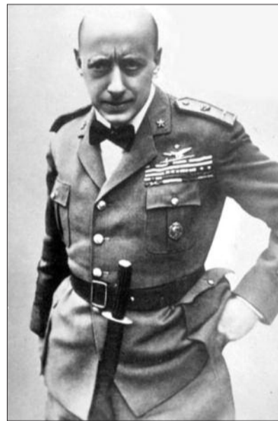
Gabriele D'Annunzio katonás pózban

Az isztriai menekültek második nagy hullámát a Josip Broz Tito vezetett partizánok győzelme indította el. Az antifasiszta ellenállók és a civil lakosság ellen elkövetett kegyetlenkedéseket – az olasz fasiszták brutálisan megtoroltak minden partizánakciót, Rab szigetén koncentrációs tábor is működött – kamatostul megtorolták a jugoszláv csapatok. A bosszú oly mértékűre sikeredett, hogy számos olasz történész etnikai tisztogatásnak tekinti az 1945-ben történteket. A tömeges kivégzések „mészárlás a szakadékokban” néven váltak hírhedtté, mivel a partizánok – nem bajlódva a tömegsírokkal – a térségre jellemző karsztos hasadékaiba, szakadékaiba lökték, illetve lökték a „fasiszta elnyomókat”. Az áldozatok száma bizonytalan: a történés-