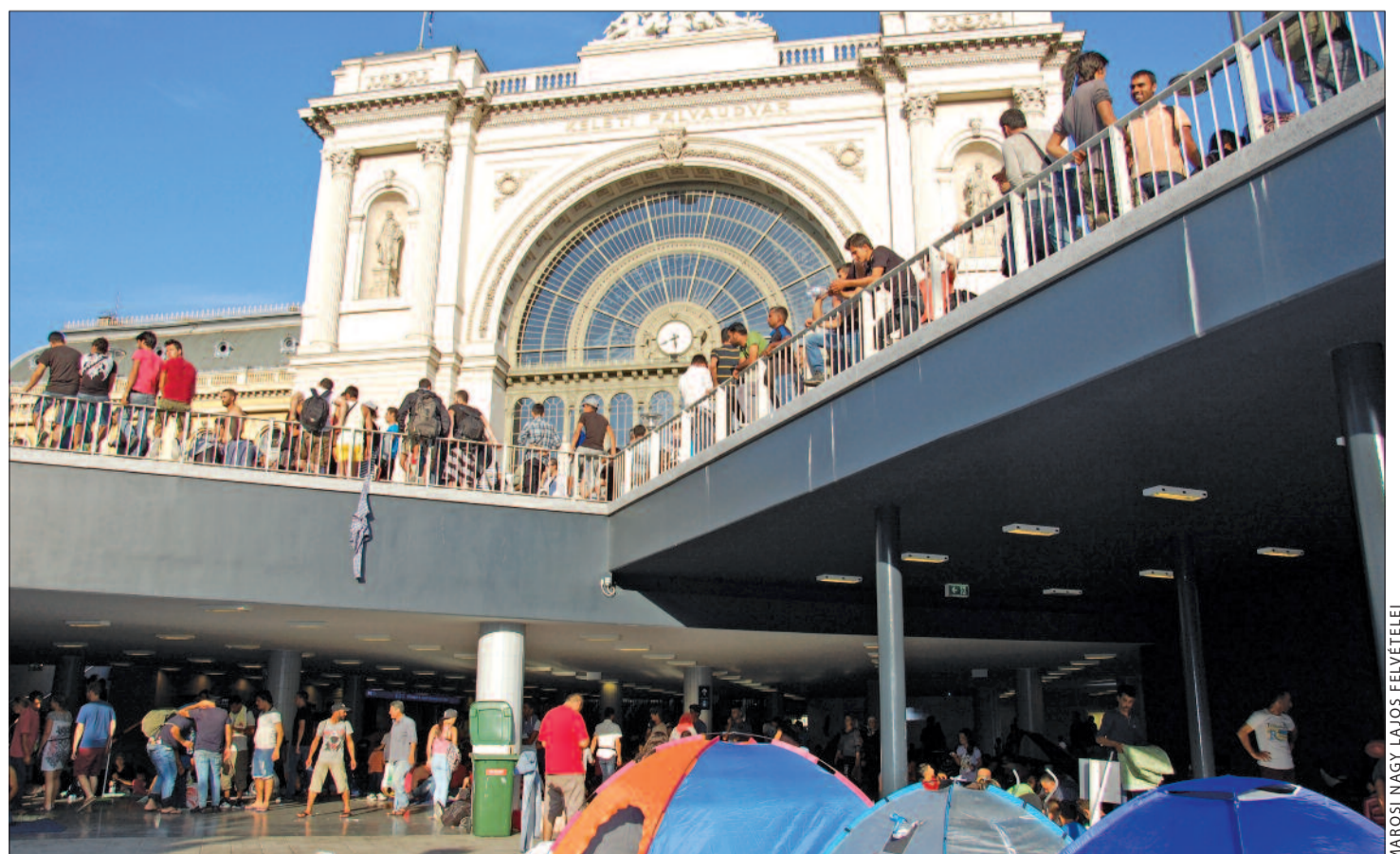
MAROSI NAGY LAJOS FELVÉTELEI