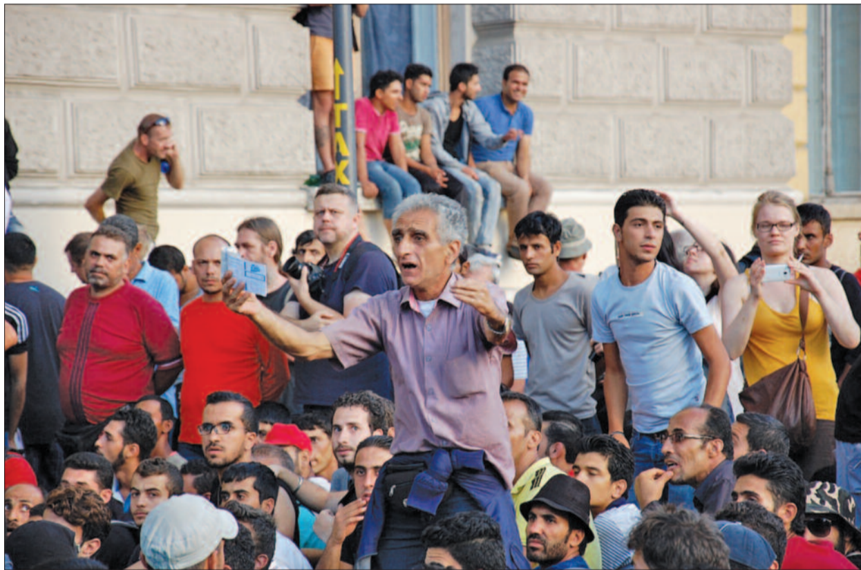
Felháborodott menekült mutatja fel menetjegyét

Több mint egy órát töltöttem a tömegben, számos felvételt készítettem, és számos tapasztalattal gazdagodtam. Áttörve magamat a rendőrkordonon, ismét buszra szállok, indulok hazafelé. Fejemen száz meg száz gondolat: amiket eddig gondoltam, és