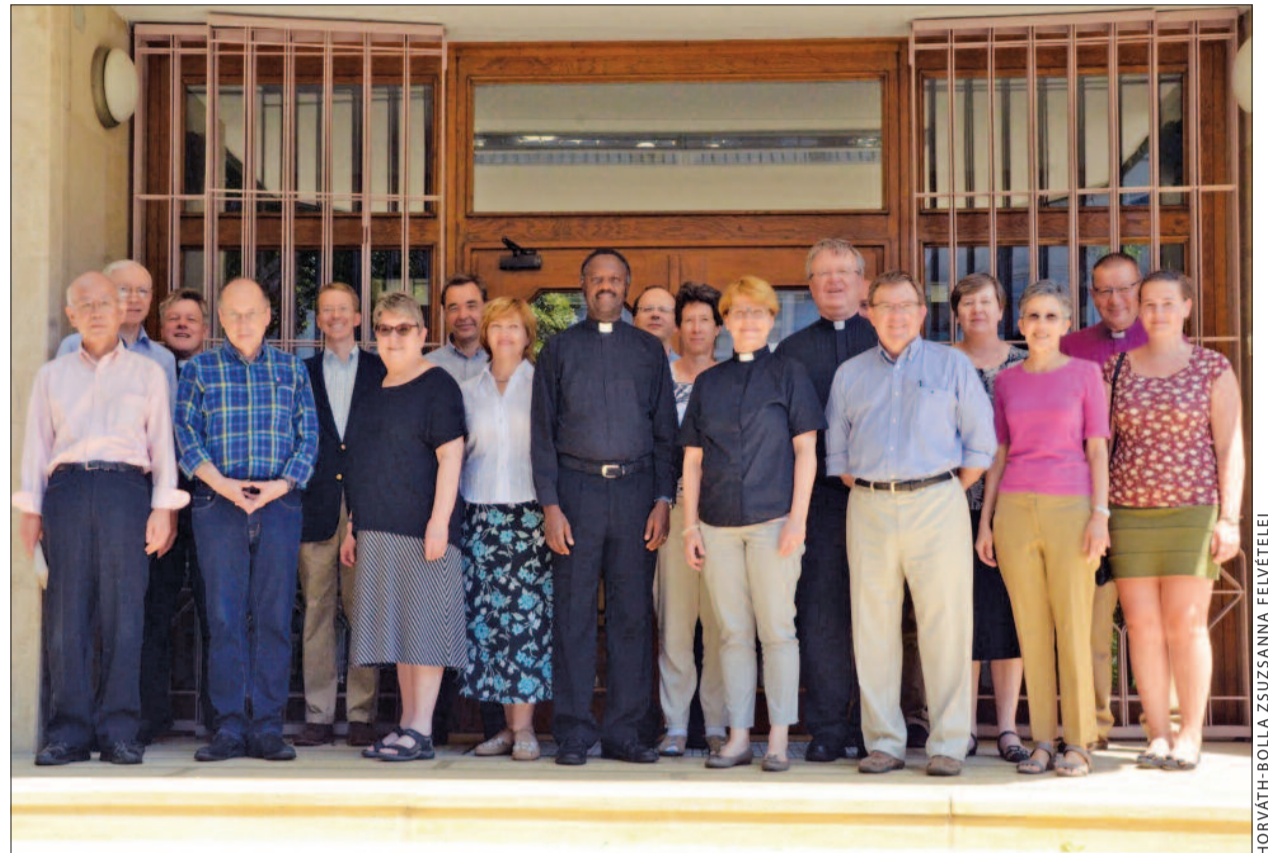
A bizottság tagjai az Evangélikus Hittudományi Egyetem bejárata előtt

A párbeszéd és ez a közös szöveg csak úgy jöhetett létre, hogy a felek minden más kérdést kikapcsoltak. Nem beszéltek tehát arról, hogy az evangélikusok, akik az asztal másik oldalán ülnek, egyház vagy nem egyház. Az evangélikusok sem mondták azt: beszéljünk arról, hogy Mária-nak a társmegegyezéséről mit tanítanak a katolikusok. E kérdésekkel a tárgyalásokon nem foglalkoztak, mert akkor még ötven évig kellett volna ott ülni. Tehát csak arról beszéltek, ami a megigazulással kapcsolatos. Ez érthető, de természetesen ebben van az egész vállalkozásnak a kérdésessége. Semmiképpen sem szabad arra gondolni, hogy ezzel most már minden kérdés megoldódott.