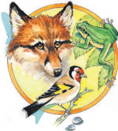
MESÉLNEK AZ ÁLLATOK

Vannak úgynevezett sztyepei, illetve erdei elefántok. Előbbiek a nagyobbak, és miután nyílt területen élnek, életmódjuk is jobban ismert. Legtöbbjük az erdős szavannán él, de