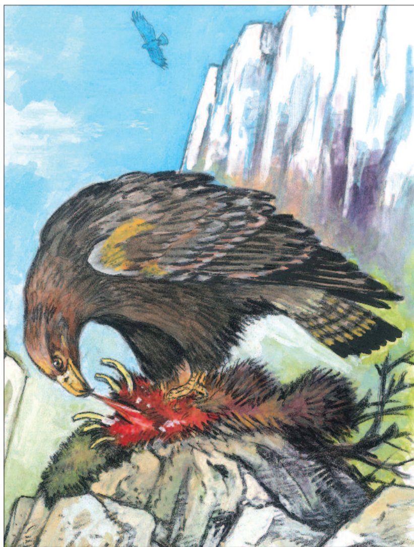
RAJZ: BUDAI TIBOR

valamint ugató „hje-hje-hje” hangjaikat.