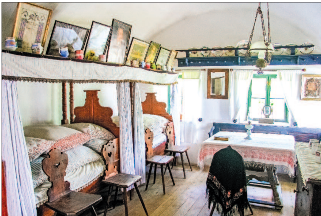
A harkai ház egykori lakóinak jómódjáról árulkodó berendezés