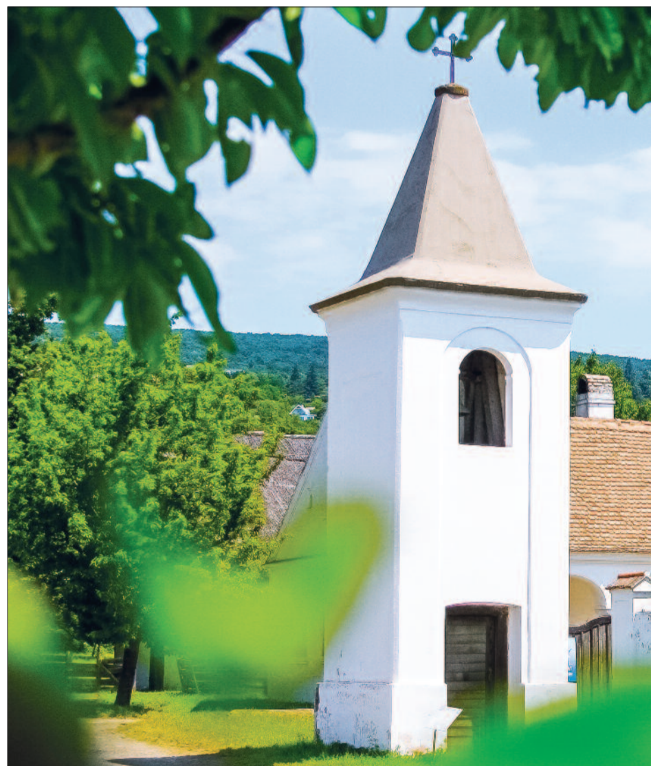
Az alsószopori evangélikus harangláb

rendeztek be kiállítást a muzeológusok, mert belső tereit felújítják, így a kiállított tárgyakat kipakolták. Ha minden jól megy, a skanzenlátogatók talán ösztől, de legkésőbb jövő tavasztól ismét megtekinthetik.