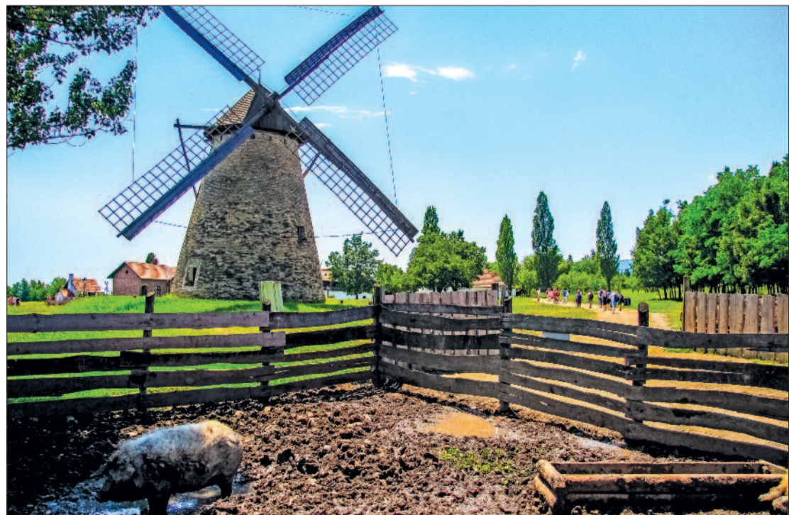
A dusnoki szélmalom

porral, Alsószopporral és Makkoshetyével. Ezek lakói a szomszédos Nemeskér templomába jártak istentiszteletre, de az alsószoporiak 1855-ben harangot öntettek, tornyot építettek, és ha halott volt a faluban, tűzvész ütött ki, vagy vihar közelgett, na meg persze a nagy ünnepeken, meghúzták a kötelét.