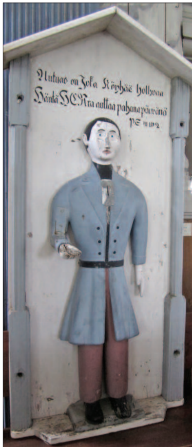
A koldusszobrokat gyakran őrbódéokra emlékeztető kis kunyhókba állították

A történet 1649-ben kezdődik, amikor Finnország nem önállóan, csak a svéd birodalom részeként létezhetett. Ekkor hozta a hosszan uralkodó svéd királynő, Krisztina (1629–1689) a pénzügytő farónkok kitételeire vonatkozó rendeletét. Ezek a templomközelben álló „óriásperselyek” azonban túl személytelenek bizo-