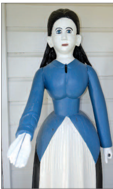
Az egyetlen női koldusszobor Soiniban

Miért is írtam le most röviden a finn evangélikus egyház történetéhez mindmáig szorosan hozzátartozó kolduló figurák történetét? Főként és elsősorban azért, mert hihetetlen lelki finomságról, az egykori és mindenkor rászoruló megkíméléséről tesznek tanúbizonyságot. Ezek a mintha-lelkük-volna faragványok