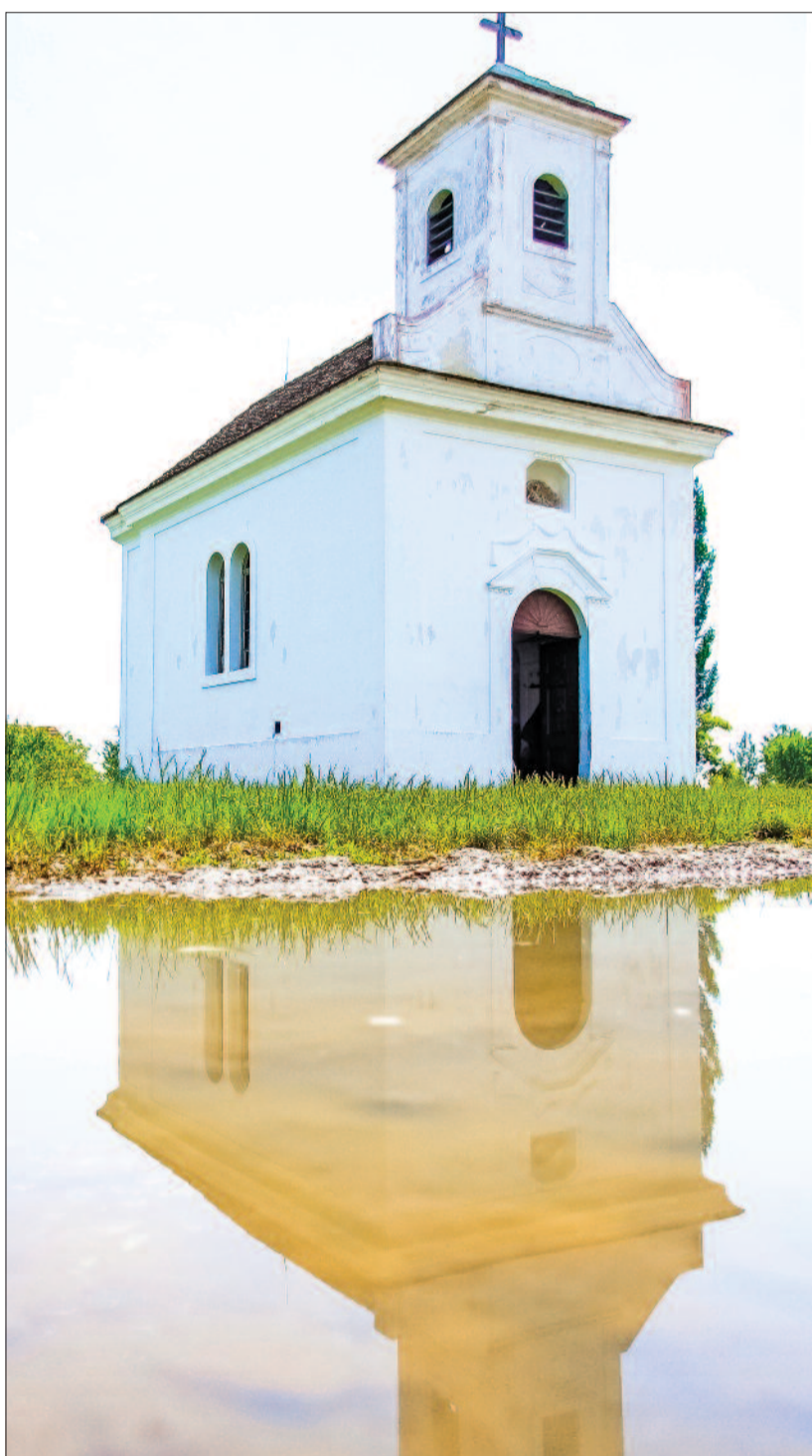
A jánosmorjai katolikus fogadalmi kápolnában mutatják be évről évre a mendei evangélikusok a skanzen látogatóinak a pünkösdi templomdíszítés hagyományát

Bár evangélikus templom nincs a skanzenben – csak római és görög-katolikus, illetve református –, azért a lutheránus egyházi építészetet is képviseli valami. Egy kis gyöngyszem a kisalföldi Újkérről harangláb formájában. Újkér maga katolikus település volt, de egybenőtt – és ma már közigazgatásilag is egy – három evangélikus falucskával: Felsőzso-