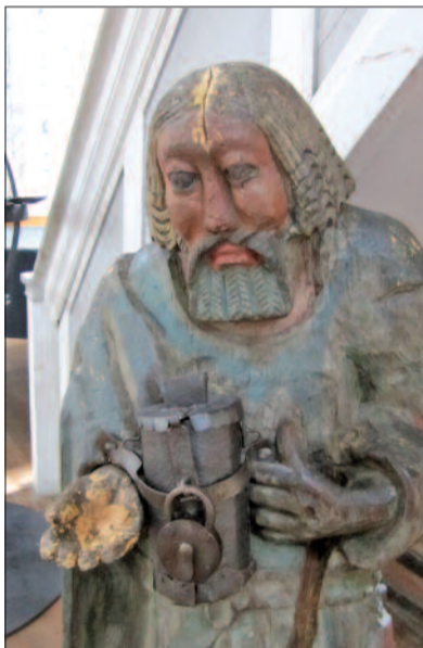
A hauhoi vak Bartimeus – a legrégebbi koldusszobor a 17. század végéről

ugyanis levették/leveszik a kéregetők válláról azt, ami a legnehezebb: a személyes megalázkodás, a templom előtti tülekedés, a nevetségesség válás és a visszautasítás terhét.