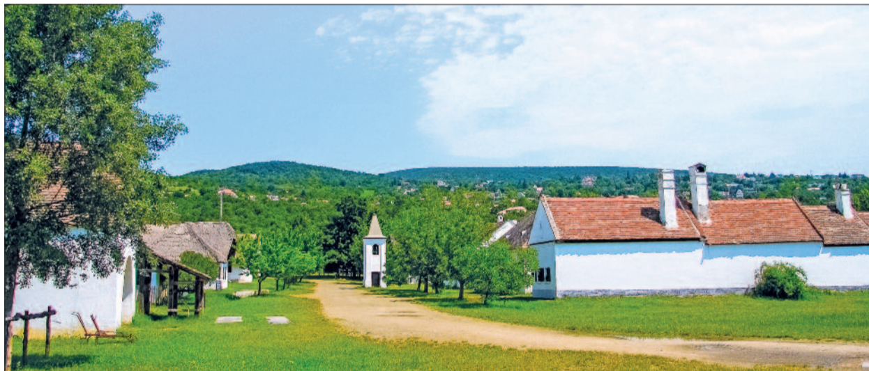
A kisalföldi utca, középen az alsósopori haranglábbal, a kép jobb szélén a harkai hosszúházzal

tött kendőkkel díszítik fel – evangélikus templom híján – a Jánossomorjáról ide telepített katolikus fogadalmi kápolnát.