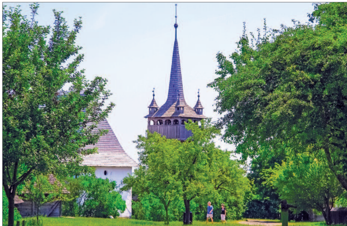
A négy fiatornyos református harangláb évtizedek alatt a skanzen szimbólumává vált

És hogy honnét tudjuk, ha református gazda házában járunk? Hát onnét, hogy az ágy fölé a falra bibliai aranymondásokat aggatnak, a Tiszántúlon pedig a magyar szabadságharc hősei – Bocskai István , Rákóczi Ferenc vagy épp az aradi tizenhárom – köszönnek vissza a keretbe foglalt, üveg alá tett nyomtatványokról, ahogy a Felföldön a református hit hősei – Kálvin János genfi reformátor mellett I. Rákóczi György fejedelem és felesége, a református nagyszony, Lo-rántffy Zsuzsanna arcképei – jelennek meg.