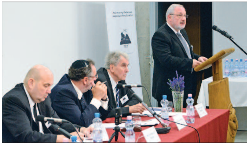
Hafenscher Károly referátuma

Kiss-Rigó László szeged-csanádi megyés püspök többek között abban látta a kereszténység szerepét, hogy „a serdülő társadalmat segítse a felnőtté válás felé”. Az egykori kemény, majd puha diktatúra után ma az „értékesség diktatúrája” uralkodik. Ami a modern népvándorlást illeti, az egyhá-