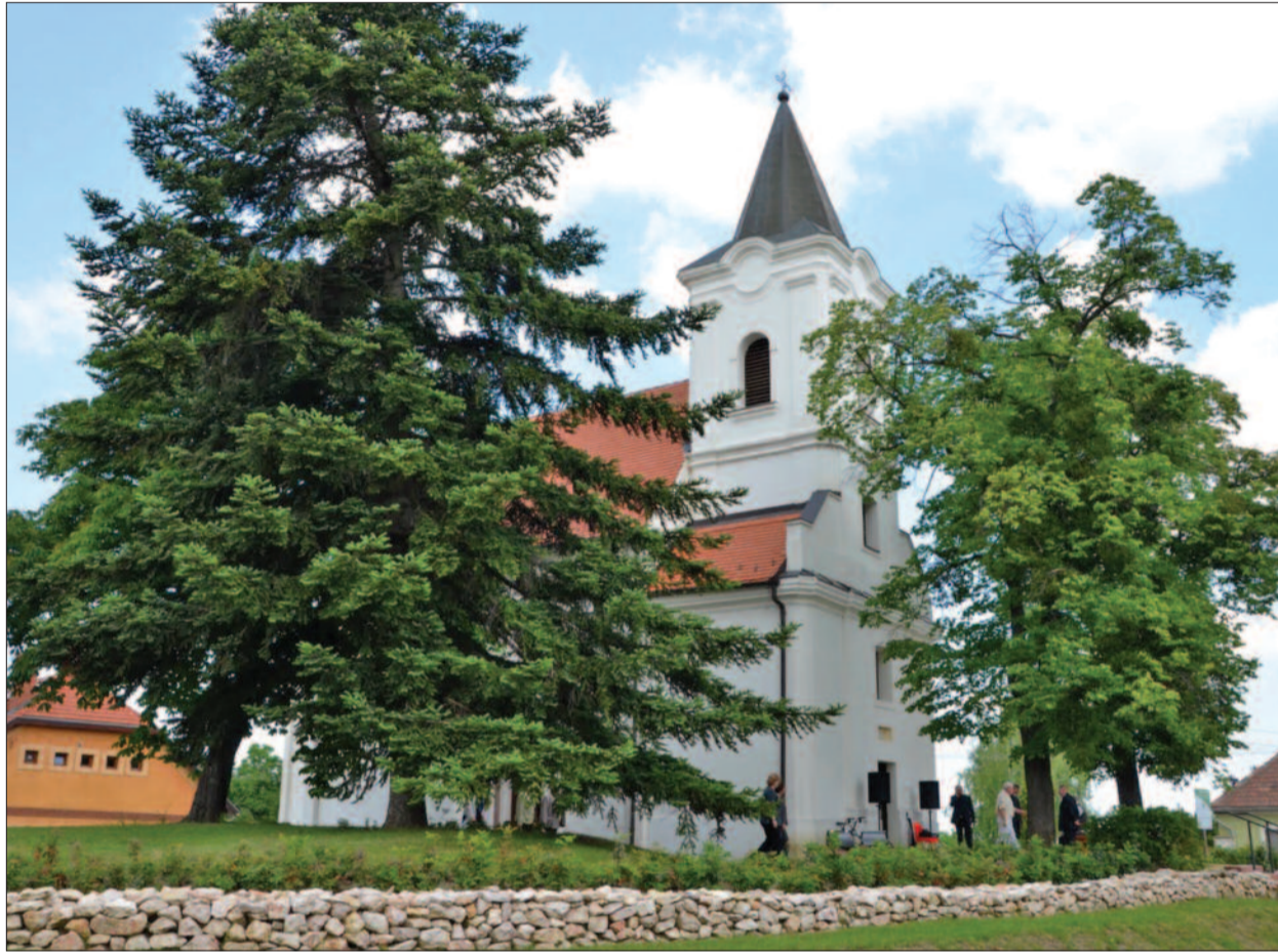
Eredeti állapotában a bakonyszentlászlói templom

Napirenden a Kornéliusz program ► 3. oldal Ez az a nap! – tizenöt éve ► 6. oldal Fenyvesi Félix Lajos jegyzetlapjaiból ► 8–9. oldal Aki kézen fogja a sellőt ► 11. oldal A berni döntő... ► 13. oldal „Csak ment és teregetett némán” ► 15. oldal