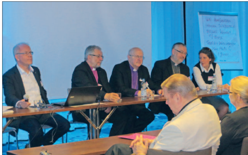
Püspökök egy asztalnál