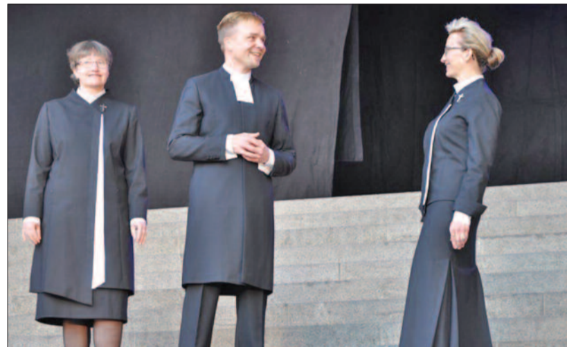
Lelkési öltözetek bemutatója

Az alig húszeszes lélekszámú inkeri egyház Oroszország területén végzi szolgálatát. A finn nyelv használata egyre inkább visszaszorul, és ma már nemcsak a szibériai kis finnugor népek körében fejt ki az egyház missziós tevékenységet, hanem minden népnek hirdetik az evangéliumot.