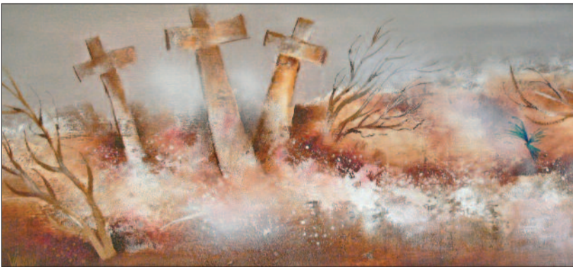
Várkonyi János: Néma csend (részlet)

Azt kell mondanom, hogy én vagyok hálás, hogy itt lehetnek, ebben