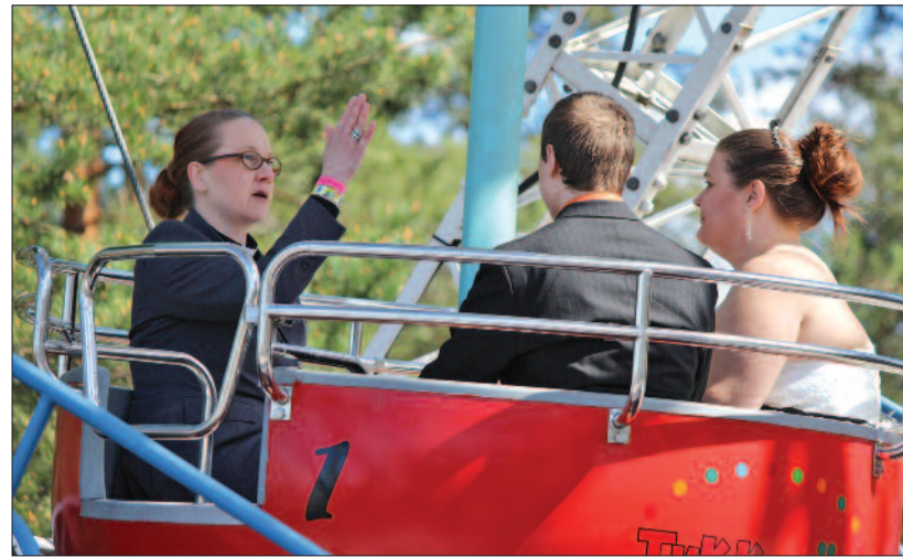
Áldás az óriáskeréken

Észtországban Urmas Viilma érsek két új püspököt állított szolgálatba. A május 1-jén Haapsaluban beiktatott Tiit Salumäe nemcsak a nyugati országrész, de a diaszpórában élő észtek gondozását is feladatul kapta. A világháborús emigrációs hullámot követően, az észti függetlenség 1991-es helyreállítása óta körülbelül százezer észti költözött vagy ingázik Finnországba. Az ő gyülekezetekbe való integrálásuk új kihívás, amelyben az észtek a finn egyház segítségét kérik. Kevés ugyanakkor az észti tudó finn lelkész, ezért a döntés-