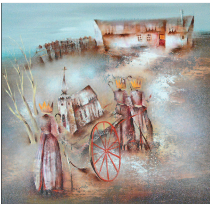
Várkonyi János: Betlehemesek

– Amikor a képek átadása zajlott – Gáncs püspök úr jelenlétében –, tödultak ide az emberek. Olyanok is eljöttek, akik nem kötődnek szorosan