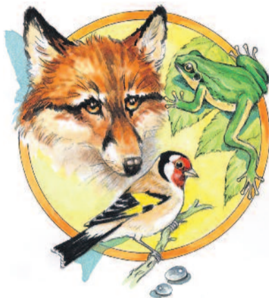
MESÉLNEK AZ ÁLLATOK

Korábban megszokott látvány volt az istállók kis ablakán ki- és berepülő fecske. A hím vagy az udvar sarkában álló fa száraz ágán, vagy a ruhaszárító kötélén ülve csicsergett