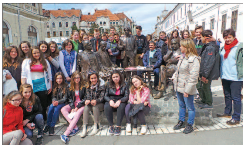
Soltvadkerti diákok tanulmányi kirándulása a Partiumban