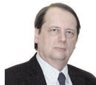
Gáncs Péter püspök Déli Egyházkerület

Sajnos lassan vége a színpompás májusnak, elmúlik a gyermeknap is... Számunkra viszont az év háromszázhatvanöt napja Isten gyermekeinek napja lehet – egy reménységünk szerint egyre inkább Krisztus-arcú egyházban. Így legyen!