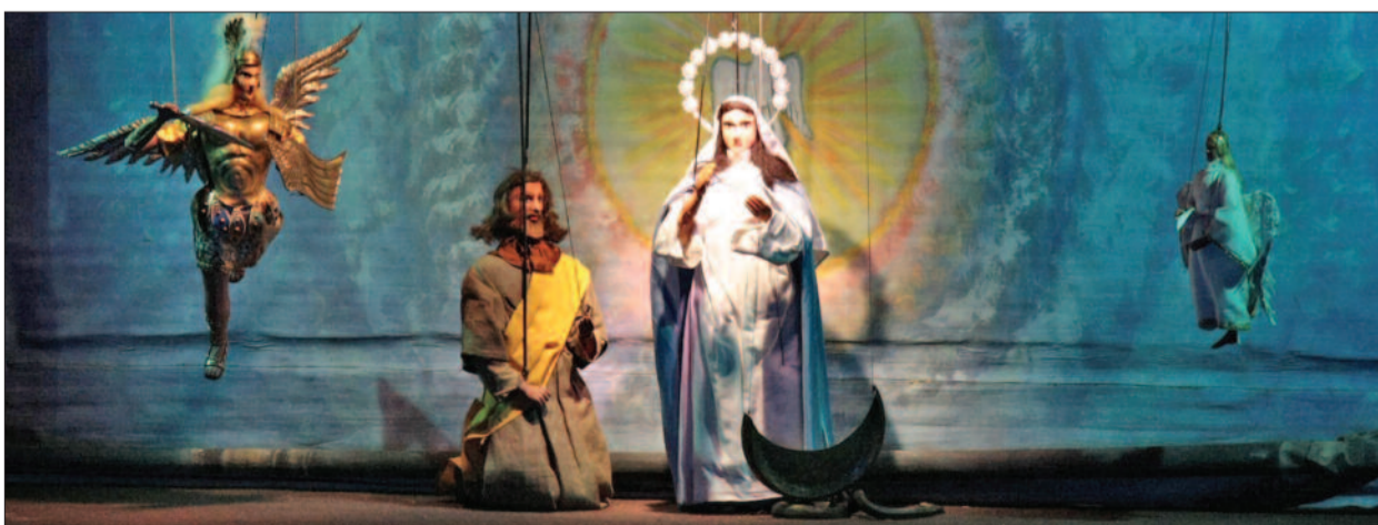
Jézus születése a cataniai Fratelli Napoli Marionettszínház (Szicília – Olaszország) bábelőadásában