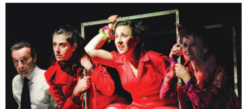
Csodák hálójában – a Teatro Iaia, a Teatro di Roma és a Teatro Stabile di Biondo di Palermo (Olaszország) közös zenés játéka

A tizenhét – köztük számos markánsan katolikus – produkciót felvonnultató, szentmisével megnyitott