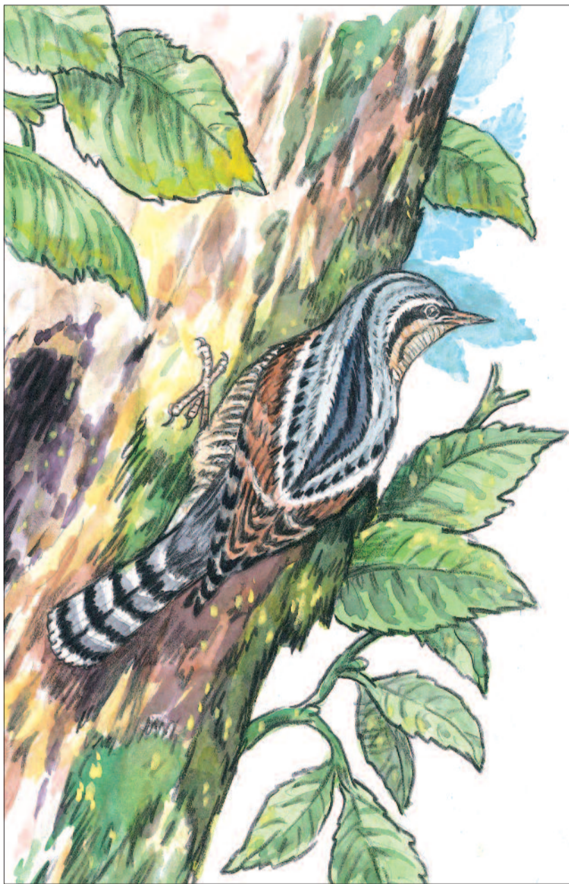
RAJZ: BUDAI TIBOR

onnan néha az ott már megtelepedett cinegét is kilakoltatja.