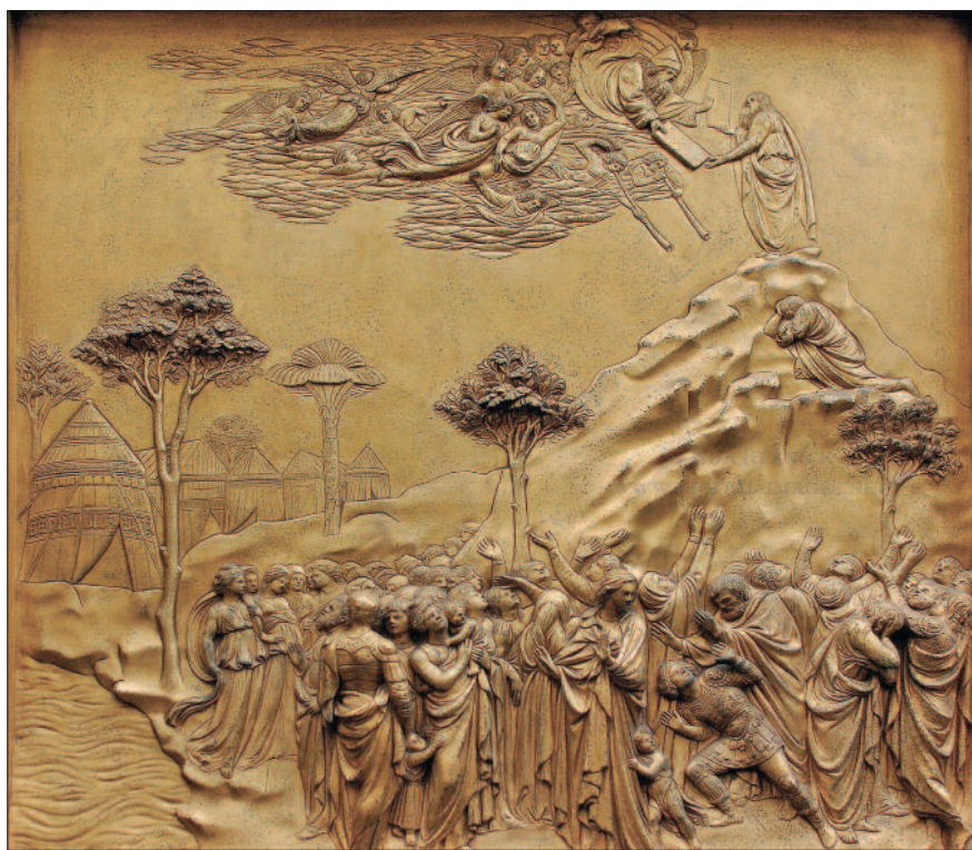
Mózes a Sínai-hegyen átveszi a törvénytáblákat

– Mózes hosszú életútjának alapvetően négy nagy eseményét emeli ki az ószövetségi hagyomány. Az első a csipkebokorélménye a pusztában, amikor elhívását kapta Istentől (2Móz 3). A második nagy esemény az Egyiptomból való kivonulás (2Móz 14), amikor száraz lábbal vezet-te át népét a Vörös-tengeren, eredeti nevén Nádas-tengeren. A harmadik nagy jelentőségű