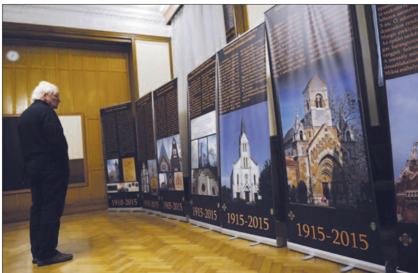
Részlet a 100 éves templomok a Kárpát-medencében című kiállításról