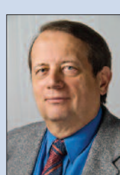
Evangélikus istentisztelet a Duna Televízióban

A sokrétű szolgálat hűen tükrözi vissza a szarvasi gyülekezet sokszínűségét, amelyben meghatározó az örökség ápolása, de a helyi közösség a hétköznapiakban mindig keresi a nyitás lehetőségét is a körülötte élők felé.