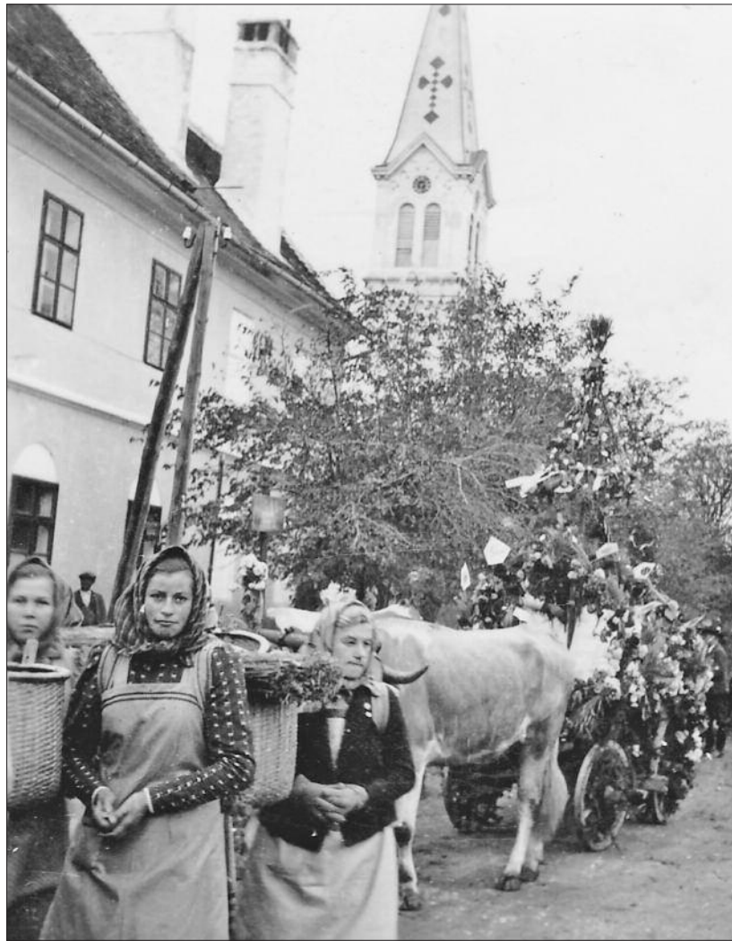
Szüreti felvonulás 1936-ban (háttérben a parókia és a templom) ▲