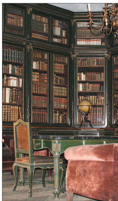
A Podmaniczky–Degenfeld-terem. A bútorokat restaurátorok újítják fel

megtölteni. A kézikönyvtárat, amennyire a mostani hely lehetővé tette, magunkkal hoztuk, nem új lelemény.