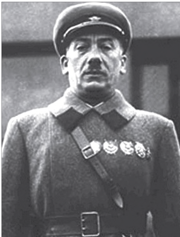
Genrih Jagoda, az NKVD-vezetője (1936. május 1.) 44

A menesztett belügyi népbiztost 1937. február–márciusi plénumon már súlyos politikai támadások érték Jezsov és Sztálin részéről. Itt Jezsov (Sztálin utasítására) bejelentette, hogy a korábbi vezetés idején azok a börtönök, amelyekben a trockistákat, Zinovjev híveit és a jobboldali elhajlókat őrizték, igen hamar „üdüllökké” változtak – a rabokkal „liberális” volt a bánásmód. 47 Jezsov felháborodással szólt arról, hogy a politikai foglyok éhségstrájk-