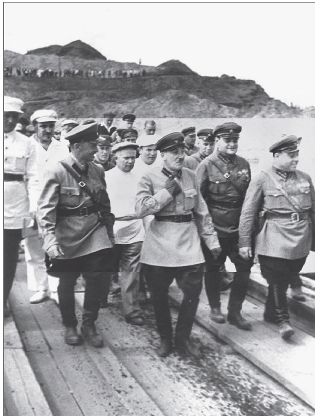
Jagoda megsemmisíti a Moszkva-Volga csatornát építő Gulag-tábort (1935. szeptember 3.) 14

alakult a Gulag, az ugyanebben az évben felállított NKVD (Össz-szövetségi Belügyi Népbiztosság) szerve, az első olyan hivatal, amely egy kézbe fogta össze a kényszermunka-intézményeket és működésüket összehangolta. 13