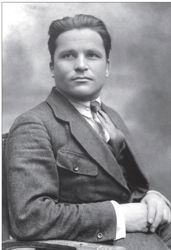
Szergej Mironovics Kirov 16

Sztálin volt az utolsó egyike, akik megtudták, hogy a Kirov-gyilkosság titka immár széleskörűen ismert. Ez