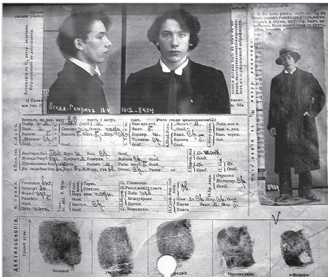
Az Ochrana nyilvántartó lapja Jagodáról 1912-ből

lius 29-én tagja lett a Cseka kollégiumának; decemberben már adminisztratív vezetőként szignálta a Rendkívüli Bizottság egyik rendeletét. 1923 szeptemberében foglalta el Menzsinszkij mellett az OGPU második elnökhelyettesi posztját, majd Dzerzsinszkij halála után első elnökhelyettesé nevezték ki. 6