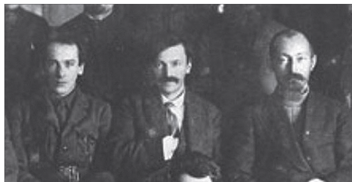
Genrih Jagoda, Vjacseszlav Menzsinszkij és Felix Dzerzsinszkij (1924) 7

Ebben az időszakban a sztálini terror következtében hatalmasra duzzadt mennyiségű politikai fogoly elhelyezése komoly problémát jelentett a vezetés számára. Ennek megoldása érdekében a Politbüro 1929. június 27-én megerősítette a határozatot a „bebörtönzöttek munkájának felhasználásáról”, amelyet az ország távoli és vidékein létesítendő táborokban kell realizálni kolonizációs céllal, valamint természeti kincsek kitermelése végett. 8