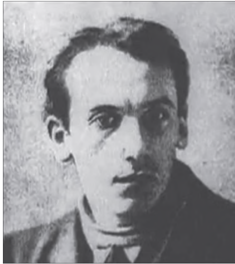
Genrih Jagoda 1915-ben 4