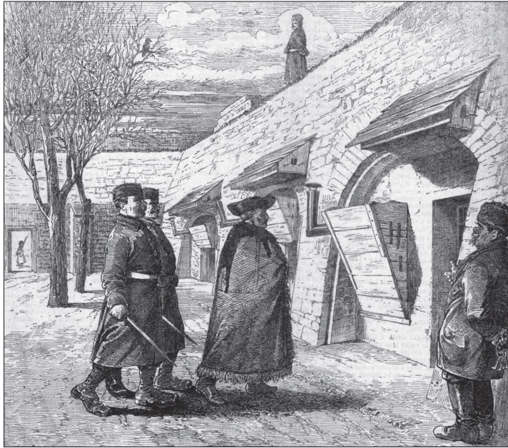
Rózsa Sándor „hírhedt rablóvezér börtönébe kísértetik” (Magyarország és a Nagyvilág, 1872. 12. sz. 135. p.)

Az ügyvéd beszéde kezdetén leszögezte, hogy védené „oly sok, számos büntettekkel van terhelve, hogy annak védelmére és teljes fölmentésére nem vagyok hiú, és Rózsa Sándor sem oly elfogult, hogy azt hihesse”. A továbbiakban azt domborította ki, hogy