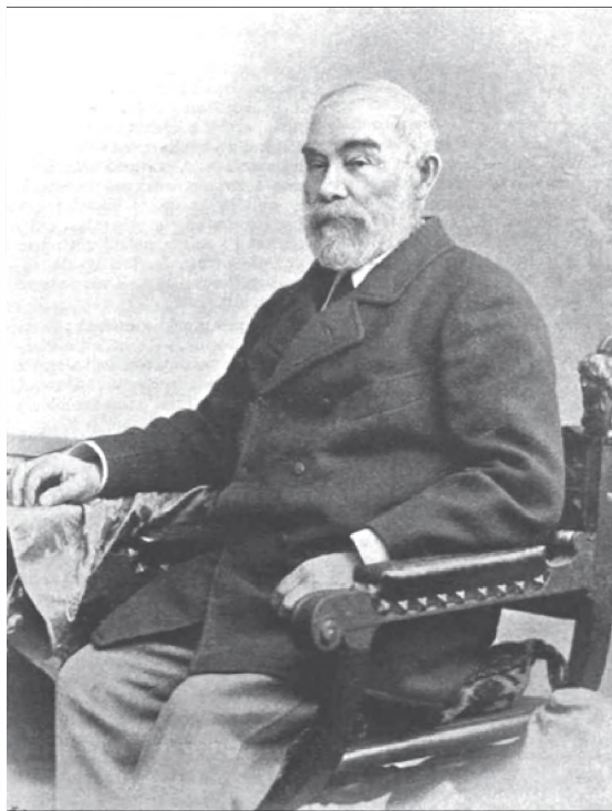
Kozma Sándor királyi főügyész 37

Végezetül – némiképp még a komisszárga is utalva – a „bicskás” jelző magyarázata álljon itt – kommentár nélkül. Családtörténeti művében Kozma György egy érdekes anekdotát szentel nagyapja somogyi származásának, megjegyezve, hogy a történet valós: