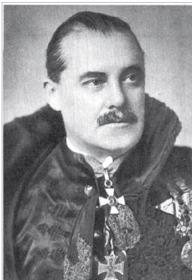
Kozma Miklós belügyminiszter (Tolnai Világlapja, 1937. február 10.)