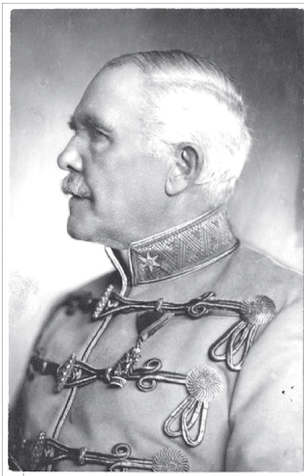
Bárd Miklós (Kozma Ferenc) költő 45

Versei a legjelentősebb országos lapokban jelentek meg, az irónia és a szatíra mestereként rendszeresen kommentálta az aktuális politikai történéseket, de műfordítással is foglalkozott, Goethe Faustját a Nemzeti Színház színpadra vitte az ő fordításában. 1893-tól tagja, később másodtitkára, majd főtitkára volt a Kisfaludy Társaságnak, 1901-től az MTA levelező tagjának, 1920-ban tiszteleti tagjának választották. Állítólag Merényi Oszkár irodalomtörténész Kaposváron az 1940-es évek elején kezdeményezte egy Kozma Andor Múzeum létrehozását, de erre ismeretlen okból nem került sor. 48