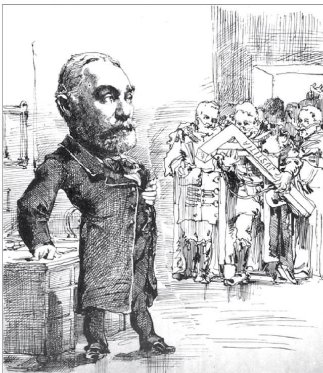
Kozma Sándor (Az Üstökös, 1882. március 26.)

Kozma Sándor főügyészi működésének – ami összeforrt az ügyészség történetével – méltatására rendszeresen sor kerül szakmai rendezvényeken, megemlékezéseken, és a témát – elsősorban Nánási László, Nagy Károly, valamint Szendrei Géza munkásságának köszönhetően – számos írott anyag dolgozza fel. 33 Ugyancsak élénk érdeklődés mutatkozik a hivatali működésének idején zajlott tisztaeszlári per folyásának és hátterének feltárására, amelyben egyéb források 34 mellett részletes képet adnak a perben vezető védői szerepet betöltött Eötvös Károly, egy bő évszázad távlatából Kövér György, és legutóbb Blutman László könyvei. 35 E helyütt ezért csupán néhány anekdotát idézek fel az első királyi főügyész jellemrajzához.