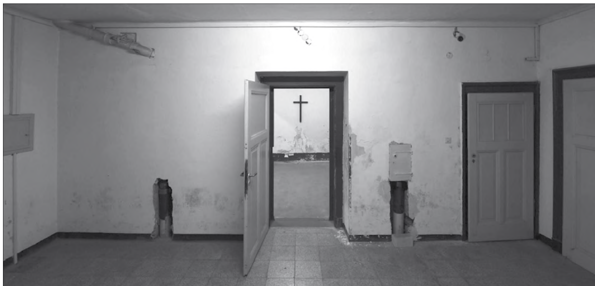
A kivégzések helyszíne 1981-ig (Lipcse) 25

ti Szövetség ( Allgemeine Deutsche Gewerkschaftsbund ) is kérték a katonai kormánytól, hogy a jövőben a súlyos élelmiszer-seftelést és a feketekereskedelmet halálbüntetéssel büntessék. 14 Még az 1950-es és 1960-as években is támogatta a nyugatnémet lakosság jelentős többsége a halálbüntetést. 15