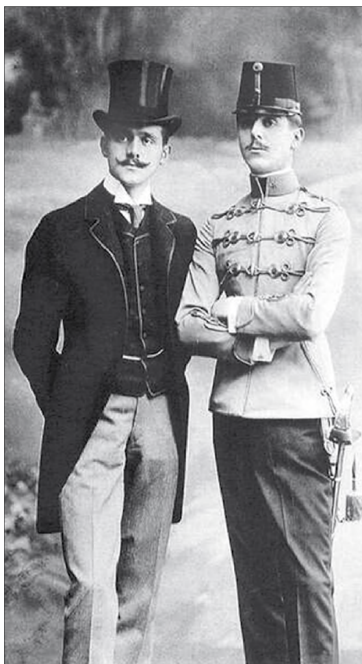
Dzsentrí testvérpár (1905 körül) 35

kontinentális keretek között pozicionáló magyarországit. Ugyanis a két, egymástól kétszáz évnyi időbeli távolságra lévő jogalkotási mozzanat, habár teljesen más eredményekkel és következményekkel járt, mégis rendkívül sok rokon vonást mutatnak egymással. Mind a kettő esetében egy radikális fordulat történt egy-egy társadalmi réteg közéleti pozíciójának megváltoztatásában, amely törvények által szentesítve alakította át a rendiségi viszonyokban, kifejezetten magyar oldalon, a gazdasági, a politikai, a társadalmi, a szociális, a mezőgazdasági, sőt még a műveltségi, a művelődési, az oktatási és a kulturális viszonyokat is. Az eredmények és a következmények azonban nyíltan eltérőek lettek. Az egyik oldalon egy kiváltságukról több téren is tanúságot tett, szellemi érdemeiben kitűnő társadalmi réteg kiemelkedését és politikai-gazdasági térnyerését látjuk. Azonban hazánk esetében a rendiség