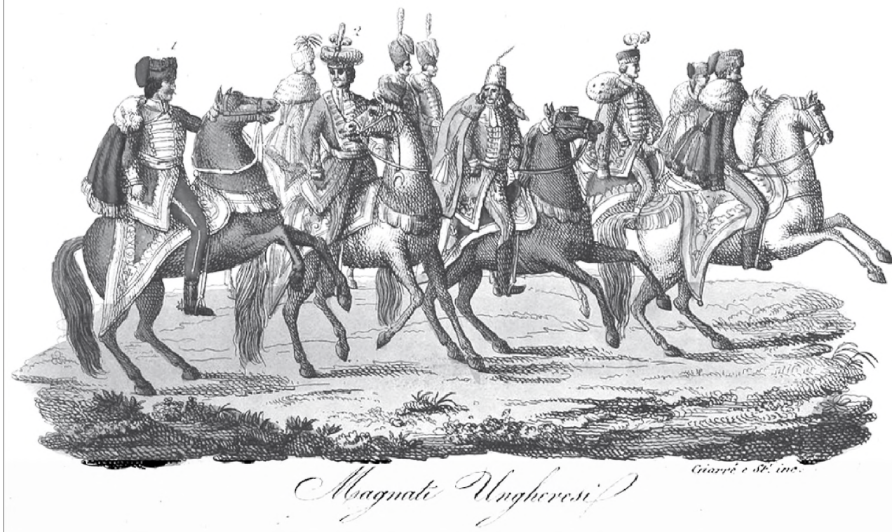
Magyar mágnások 1831 körül 5

di társadalom kialakulása óta egészen a forradalmi, 1848-as reformrendszerig állandó érdekellentétek álltak fenn, melynek háttérben hol politikai, hol vagyoni, hol személyi érdekekhez fűződő konfliktusok húzódtak.