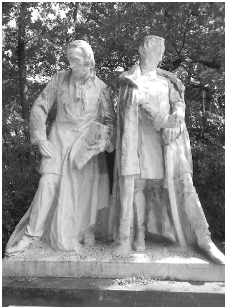
Eötvös és Széchenyi szobra Dombóváron (Horvay János alkotása)

Ennél világosabban aligha lehet megfogalmazni azt a valóságstípust, melyet Max Weber kollektív etikai forradalmiságnak tartott, azzal a döntő kiegészítéssel, hogy itt egyáltalán nem olyan tökéletesedésről van szó, amely egyéni megváltásra vagy üdvre törekszik. Az etikai töké-