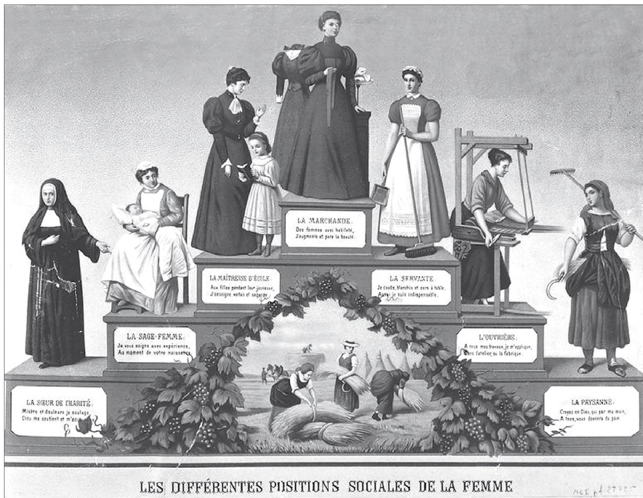
Női munkalehetőségek a XIX. század végén 56

sítése mértéke emelkedett, előbb a gőzgépek, majd a század végén már a belső égésű motorok is megjelentek. 55