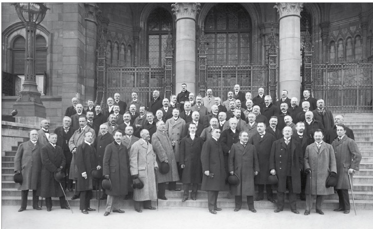
Az 1911. évi közjegyzői kongresszus résztvevői