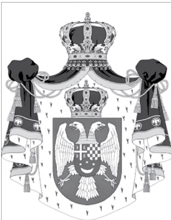
A Jugoszláv Királyság címere 4

én a katonaság, brit támogatással, elfogta Pál régent, és nagykorúnak nyilvánította a 17 éves II. Pétert. 1943-ban azonban elindult a partizánok szervezkedése és fegyveres harca, akik Josip Broz (Tito) vezetésével jajcai gyűlésükön megalakították a jövőbeli szocialista Jugoszlávia szövetségi rendszerét és állami szerveit (így a parlament szerepét betöltő Jugoszláv Népfelszabadító Antifasiszta Tanácsot, az AVNOJ-t) – egyelőre demokratikus felhatalmazás nélkül. Az 1943. november 29-én Tito által az AVNOJ második, jajcei kongresszusán kikiáltott és általa (miniszterelnökként) vezetett állam neve Jugoszláv Demokratikus Föderáció ( Demokratska Federativna Jugoslavija ) lett, azaz a köztársaság–monarchia kérdést szándékosan nyitva hagyták, II. Pétert ugyanakkor megfosztották trónjától. Az AVNOJ ideiglenes nemzetgyűléssé alakult.