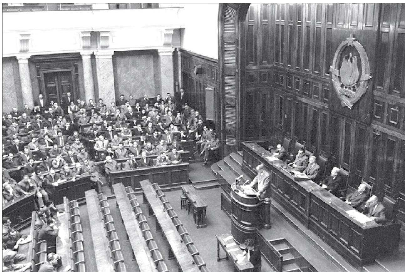
Szövetségi gyűlés (1958. október 27.) 9

Az 1974-es, utolsó össz-jugoszláv szövetségi alkotmány a nemzetek közötti feszültségek csökkentése érdekében további engedményeket tett a tagköztársaságoknak, különösen a korábban a szerbekhez képest alávett helyzetben lévő horvátoknak és szlovéneknek. Az alkotmány a tagköztársaságokat „államoknak” nevezte, és minden tagköztársaság és tartomány egyetértését írta elő a szövetségi hatáskörök meghatározásához. Minden tagköztar-