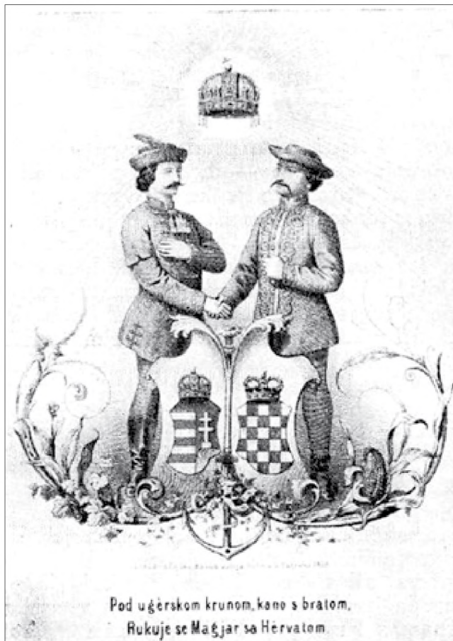
Magyarország és Horvátország viszonyának allegorikus ábrázolása (Julije Huhn, 1860 körül) 32

Mirkó Bogović köszöntésére szervezett ünnepség Zágrábban. A Deák mögött felsorakozó csoportosulás orgánuma, a Pesti Napló pedig visszatérően kiemelte olyan helyzet létrehozásának szükségességét, amikor senkinek nem kell választani a szabadság és a nemzetiség között. 34 S miközben az emigráció, Kossuthal az élén visszatérően sürgette a megbékélést előmozdító lépések megtételét, Mocsáry Lajos is örömmel üdvözölte a szívélyes hangulat kölcsönös felerősödését, amikor kifejtette: „Mi azt akarjuk, hogy minden polgára e honnak kézzel foghassa, hogy egy szabad alkotmányos országban lakik. Óhajtjuk, ha állását egybehasonlítja más országokban lakó fajrokonainak helyzetével, ne átkozza a sorsot, mely őt ide helyezte.” 35 A közhangulat javulását jól érzékeltette, hogy a megyék újjászervezését köszöntő ünnepi