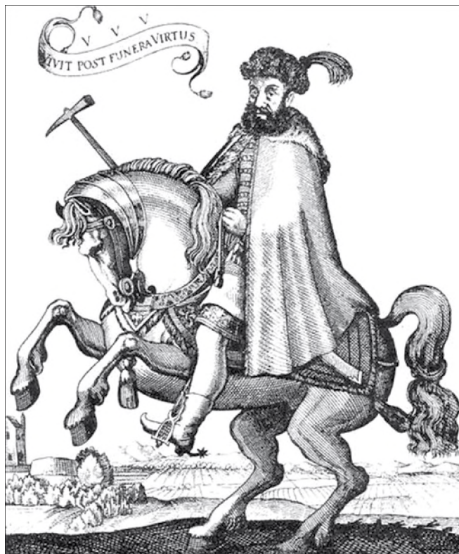
Thurzó György (1557–1616), az 1606-os füleki zendülés miatt összehívott haditörvényszék elnöke

szókkal illeti, gyalázza, jó hírében, nevében meg-becstele-níti, kissebbíti, a' Hadi Széken revideáltassék dolga, s ha meg nem bizonyíthatya a' felebaráttýára kent gyalázatot, nyelv váltságon maradgyon 22