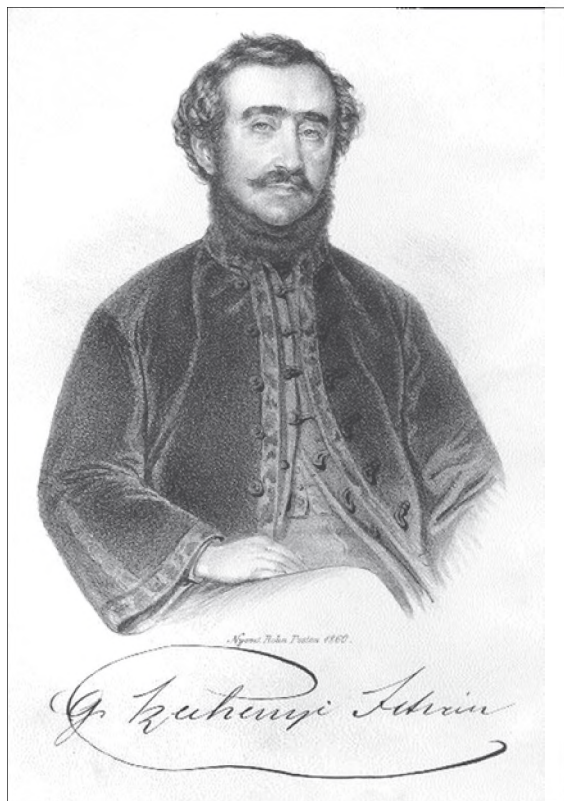
Gróf Széchenyi István

2. A nemzet megújulását mind a két 1 politikai zsenialitással megáldott statusférfi életcéljának tartotta. Széchenyi Hitel című művében kinyilvánította, hogy a nemzetiség és jobbágsors alakulásától függ nemzeti létünk. „S mi arra jutottunk, hogy a XIX. században, midőn az ember méltósága szent kezd lenni, pirulás nélkül publice beszélünk egész Európa hallatára, de misera plebe contribuyente, a külföldnek ez iránti türelmét csak előtte ismeretlen létünknek köszönhetjük, melynek következtében az azon hiedelemben van, tán csak egy kis szektáról van szó, mely vallás, a több efféle miatt sanyarítottak –, midőn azonban kilenc millióról forog kérdés, ki hű jobbágy, s mily hű! jó katona... szóval ki minden terhek türelmes viselője, s melynek oly nagy része a magyarság utolsó záloga, reménye fenntartója.” 2 Széchenyi a közszabadság eszméjéből származtatva a belső fogyasztást – mely a nemzet