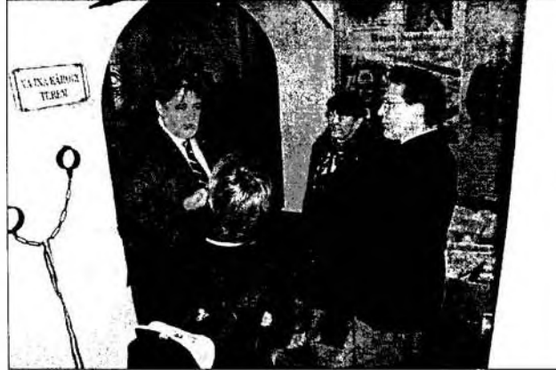
A Vajna Károly-terem avatása