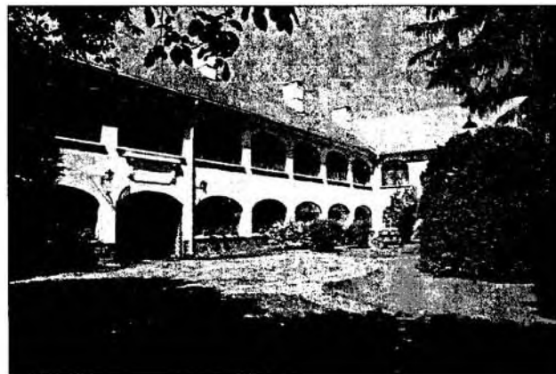
A Kiskun Múzeum belső udvara