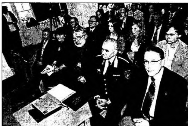
Az emlékülés résztvevői (a kép jobb szélén: Nánási László főügyész)

hogy Magyarországot a történelem folyamán mindig a megkésetttség jellemezte, és ez a büntetésügy terén is így alakult. A nyugat-európai szankciók jellemző brutalitását, kegyetlenségét szelídebb formában vettük át. Míg Nyugaton egy-egy halálbüntetés végrehajtása népünnepélynek minősült, amelyet a település központjában az e célra emelt emelvényen hajtottak végre, addig hazánkban a középkorban sem volt ez általános. Természetesen a nyilván-