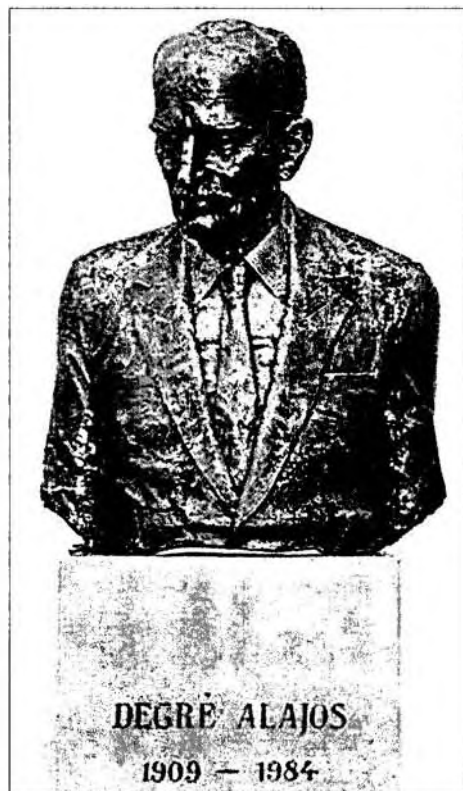
Degre Alajos szobra a zalaegerszegi levéltár udvarán

net című könyv is szinte kivetíti sodró lendületű, szuggesztív előadásait.