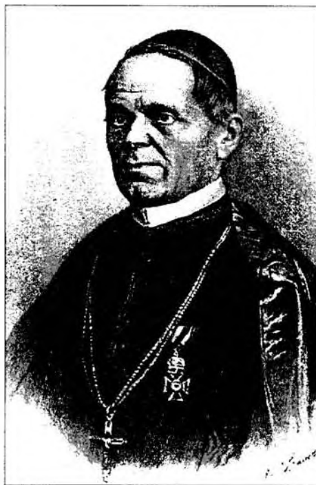
Kruesz Krizosztom pannonhalmi főapát

Mindezek alapján elmondható, hogy a szerzetes tanító rendek képviselőinek egykori parlamenti jelenléte nem öncélú „diszpozíció”, és sem állami, sem egyházi szempontból nem volt érdektelen.