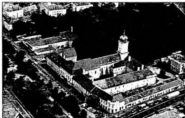
A csornai premontrei prépostság