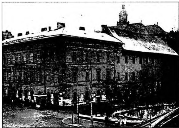
A budapesti piarista rendház és gimnázium (lebontása előtt, 1931; a mai Március 15. tér helyén)

Az 1924. augusztus 20–23. között a csehszlovákiai Teplicében tartott generális káptalanon megszüntették a Jászóvári Premontrei Kanonokrend függetlenségét, s a(z) 1921-