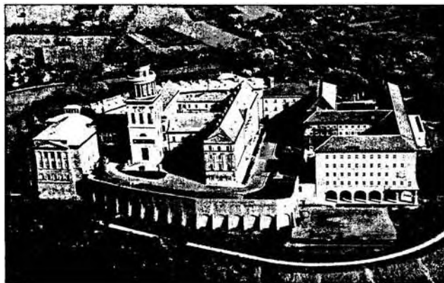
A pannonhalmi bencés főapátság

Tomcsányi Vilmos Pál igazságügy-miniszter 1921. július 20-án benyújtott törvényjavaslata 55 ( Az ország-