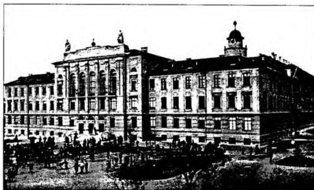
A Jászóvári Premontrei Kanonokrend gödöllői rendháza és gimnáziuma