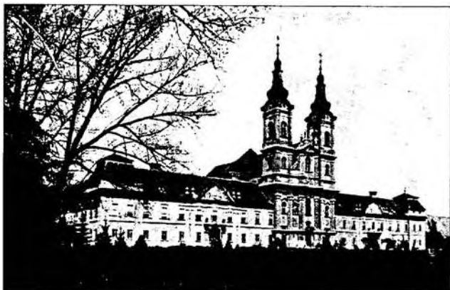
A Jászóvári Premontrei Kanonokrend székháza és temploma