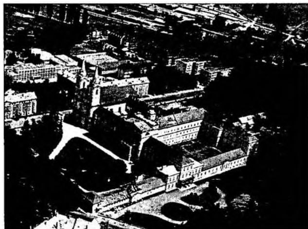
A zirci ciszterci apátság

Egyed István a papi képviselők összeférhetetlenségét vizsgálva a lelki(ismereti) függőség veszélyének lehetőségét emelte ki; 79 saját lelkiismeretükön kívül mástól nem fogadhatnak el utasítást. A vallás szabad gyakorlata ról szóló 1895:43. tc. 80 4. §-a szerint egyházi fenyték sem alkalmazható ellenük, mert polgári jogaikat szabadon gyakorolják. 81 A papképviselek összeférhetetlenségi helyzetbe jutnak, ha a Szentszéktől nem egyházi ügyekre vonatkozó utasításokat is elfogadnak (1925:26. tc. 180. § [1.], 1926:22. tc. 28. § [2.]).