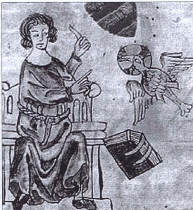
Eike von Repgow

Figyelme a középkori német és magyar városi jog történetének érintkezési pontjaira irányult. Városaink eredetkérdését sokáig vitatták. Amint az már az 1930-as években tisztázódott, kétségtelen, hogy mint települések