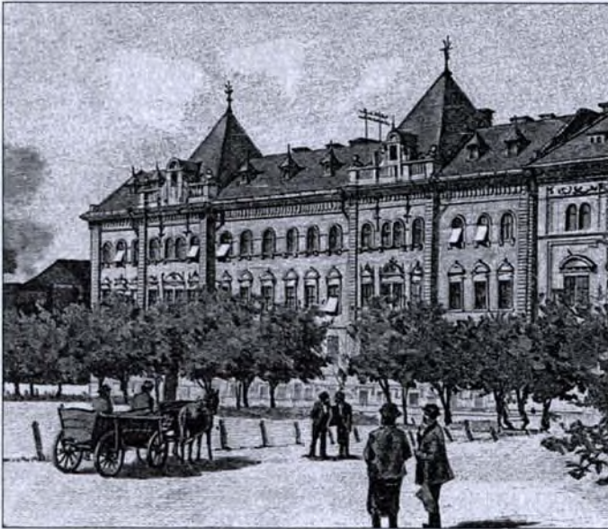
Az egykori Királyi Tábla épülete Győrben

A feldolgozás második lépéseként meg kell határozni, hogy mely bírói fórumokat érintő igazgatási tevékenységet kíván a kutatás feltárni. Ennek azért van különös jelentősége, mert az eltérő szintű bíróságok igazgatásában feltételezhetően különböző közigazgatási szervek, illetve azonos szervek különböző módon vettek részt. Az egységes elveken épülő „államosított” bírósági szervezettől eltérően a rendi korszakban a bíráskodás – csakúgy mint az igazgatás – helyi (megyei, városi, uradalmi) szinten nyugodott, csak a fellebbezési lehetőségek megjelenésével, és a központosítási törekvésekkel párhuzamosan kapott szerepet a másodfokú ítélezés. A 19. század első felében a bírósági szervezeten belül meg kell különböztetni az első fokon eljáró privilégiumra alapított fórumokat (megyei és városi törvényszékek,