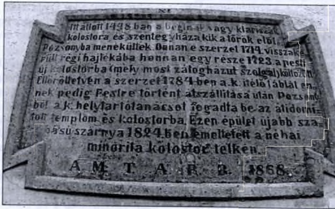
A Helytartótanács emléktáblája a budavári Úri utcában

jedt minden olyan természetű dologra, amely az uralkodót és az országgyűlést valamilyen módon érdekelte. Nem tartozott azonban ide a Magyar Kamara által végzett, szorosan vett pénzügyi igazgatás (adóügy, vámok), a nemesfémhányászat ellenőrzése pedig egyenesen az udvarban zajlott, de a tágan értelmezett pénzügyi igazgatásba a Helytartótanács is bekapcsolódott. Az ország területén állomásozó hadsereg vezényletével kapcsolatos teendőket a Hofkriegsrat látta el. A feladatokat a törvényeken kívül a kiadott utasítások (1724, 1783, 1801) határozták meg. A legváltozatosabb hatásköre a közigazgatási osztálynak volt, ide tartoztak többek között a népesség-összeírások, a bírói és más eljárási illetékek behajtása, a puszták betelepítése, a rendészeti és közbiztonsági kérdések, a rabokkal kapcsolatos ügyek. Ez a szervezeti egység kapcsolódott be a vármegyei és a városi bíróságok igazgatásába is. 60