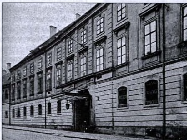
A Helytartótanács egykori palotája Budán, a mai Üri utcában

A másik jelenség az, hogy a modern magyar alkotmánytörténeti, közigazgatás-történeti és jogtörténeti szakirodalom igen sajátosan kezeli a hatalmi ágak szétválasztása (1869:4. tc.) 6 előtti bírósági igazgatás kérdéskörét. Egyrészt kifejezetten hangsúlyozza, hogy a közigazgatás és a bíraskodás szorosan összefügg: mind szervezeti, mind hatásköri vonatkozásokban elválaszthatatlan a két tevékenységi terület. 7 Sőt Torday Lajos 1933-ban kifejezetten felhívta a figyelmet a két terület szeparált elemzésének veszélyeire. 8 Másrészt az államszervezet bemutatása során a szerzők – a mai felfogásnak megfelelően – élesen különválasztva tárgyalják a közigazgatási szervezet és a