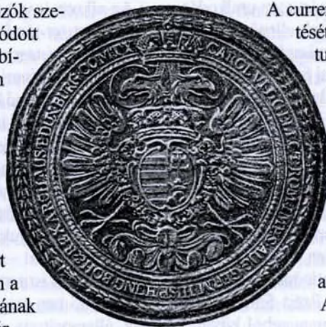
A Helytartótanács pecsétje

A Helytartótanács végezte az általános központi igazgatást és két kivétellel az összes szakigazgatást, hatásköre kiter-