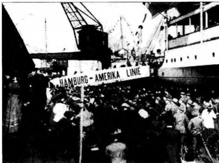
Kivándorlók szállnak hajóra Hamburgban