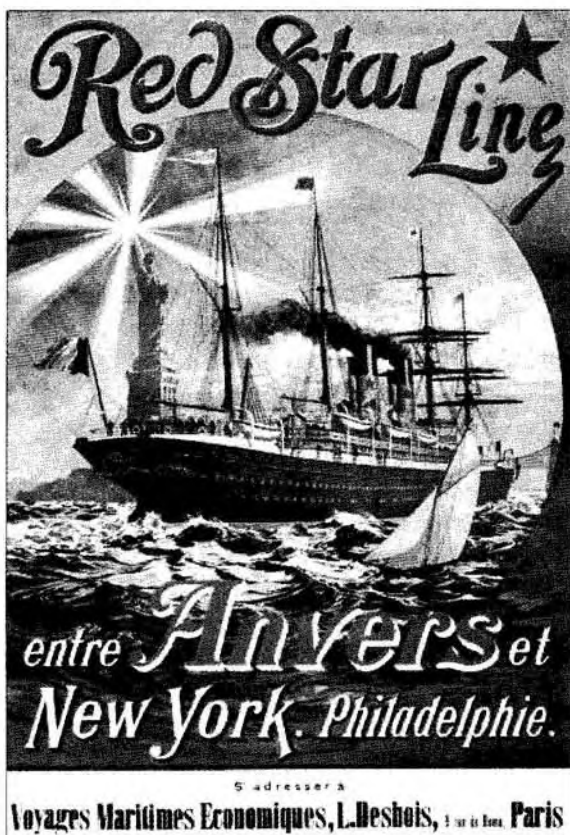
A Red Star Ügynökség plakátja

A századfordulóhoz közeledve úgy látszik, hogy a kivándorlás folyamatában olyan új elemek jelentek meg, amelyek a kormányzatot aktívabb, a korábbiakban lényegében csak a kivándorlási ügynökökre, illetve a katonaköteles kivándorlókra összpontosító hatósági cselekményeknél tágabb perspektívába helyezett stratégia követését követelték meg. Azon túl, hogy a kivándorlási statisztikák – még ha pontatlanul is – már kézzelfogható alapot teremtettek a vitás kérdések megtárgyalásához, illetve hogy a kivándorlási hullám immár a szakmai közönségen túl szélesebb érdeklődésre tarthatott számot, s nem csak a hazai sajtó, hanem a népes újvilágbeli magyar közösség sajtója is kommentálta a magyar kormány kivándorlást érintő terveit, mi több, azokat az amerikai politikai-gazdasági viszonyokkal összefüggésben elemezte és értékelte, s a kivándorlás