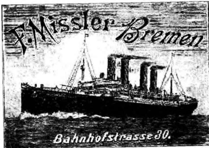
Az F. Missler ügynökség plakátja