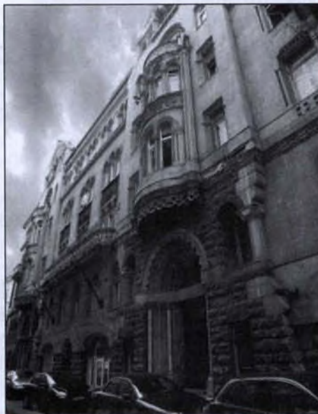
A Collegium Tökölyanum épülete mai állapotában, a budapesti V. kerületi Veres Pálné utcában