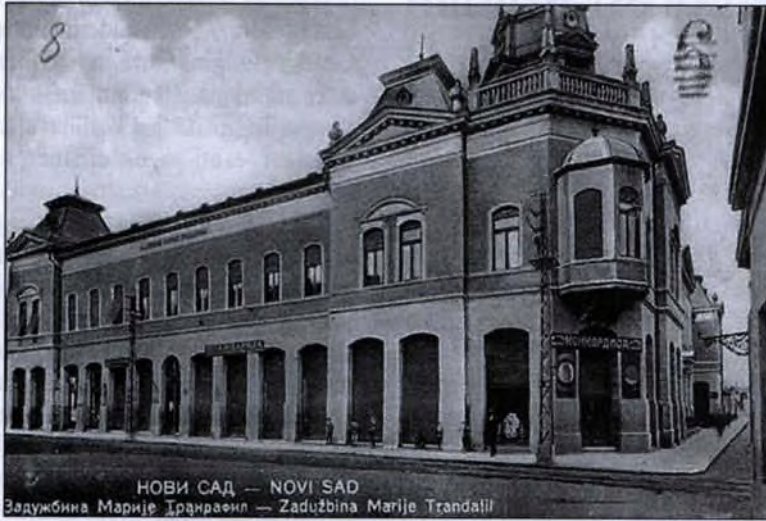
A Matica Srpska épülete Újvidéken (képeslap)

Az állam megjelenésének oka után az állam célját keresi disszertációjában. Itt K. A. de Marini, korabeli osztrák jogfilo-