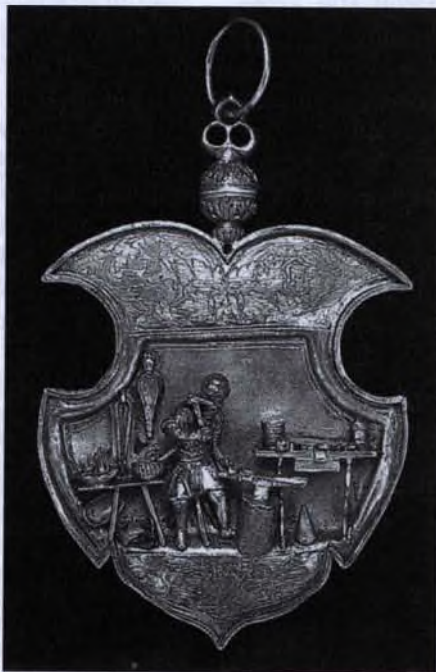
A brassói ötvöscéh jelvénye (behívó tábla, 1556)

A céhes szakképzésben történő részvétel nem volt olcsó multság. 39 Minden fokozat, s az egyes fokozatok különböző fázisaiban is az inasnak, a legénynek, de