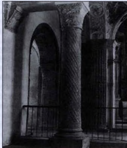
Pannonhalmi bencés apátság

Az idő előrehaladtával azonban megváltoztak a felvázolt iskolarendszer körül a körülmények: hanyatlott az uralkodó magánvagyonára épülő patrimoniális állam, a gregoriánus reform kiváltotta az uralkodói hatalom racionalizálását, kialakulóban voltak a rendek, majd a rendi állam. A körülmények változása az oktatás iránti igények átalakulásában jelentkezett elsőként, s ezen igények mentén fejlődött tovább az intézményrendszer.