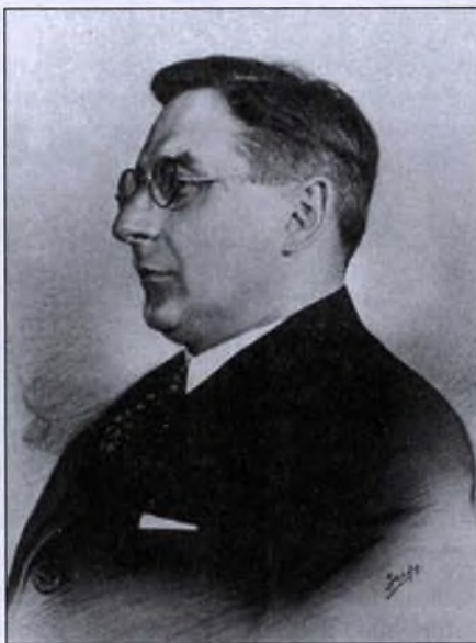
Gróf Klebelsberg Kuno

A Tanácsköztársaságban a műkincseket, a múzeumot, a kultúrpolitikát állami ügynek tekintették. Ekkor jelent meg Magyarországon az állami múzeumpolitika, centrális formában, de ugyanakkor szakmai alapokon nyugvó decentralizált múzeumirányítással (szakmák szerinti szétválasztással) karöltve. A mintát az MSZDP által kidolgozott kultúrpolitikai elvek szolgáltatták.