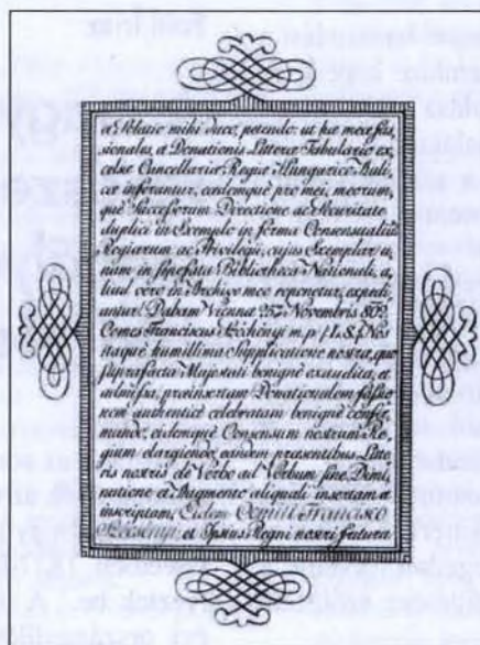
A Magyar Országos Széchenyi Könyvtár alapító levelének két oldala

Az intézmények köre bővült, a szellemi élet fellendült, a kultúra tagoltsága nőtt. 1867-ben újjáélesztették a Vallás-és Közoktatásügyi Minisztériumot (a továbbiakban VKM) – ahol otthonra talált a magyar múzeumügy –, élén olyan kiválóságokkal, mint Eötvös József, Trefort Ágoston, Csáky Albin vagy Wlassics Gyula. Ekkor a VKM IV. Tudományos és felsőoktatási csoportjának IV/2. ügyosztálya foglalkozott a múzeumokkal. 12 Ide tartozott a Nemzeti Múzeum, az Erdélyi Nemzeti Múzeum és a Közgyűjtemények Országos Főfelügyelősége.