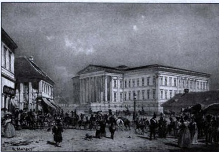
A Magyar Nemzeti Múzeum a reformkorban (Rudolf Alt metszete)

A műemlékek fenntartásáról 1881-ben szentesített és kihirdetett 1881:39. tc. a korszak jelentős vívmánya. Az intézményes műemlékvédelem, a szervezett megőrzés kialakulásának a francia forradalom 22 és a napóleoni háborúk (itáliai hadjárat) 23 adtak lendületet. A 19. századig jogi értelemben a magántulajdon erősebb volt a köztulajdonnál, de a nemzetek öntudat-