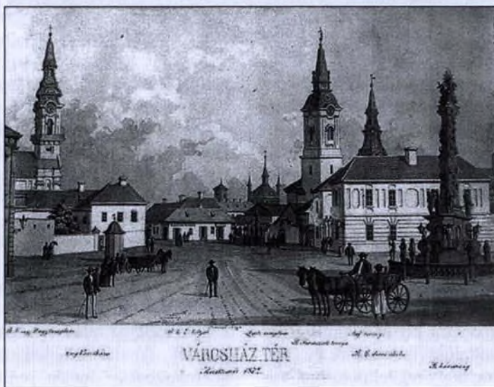
Kecskemét, Városháza tér (metszet, 1872)

A városi tanács önállósága egy mezőváros esetében eléggé szokatlan volt, a szabad királyi várostól eltérő közigazgatási egységek komolyabb autonómiával nem bírtak. Ezért Koháry István földesúrnak bécsi tartózkodása alatt, 1686. március 28-án rendeletet kellett kibocsátania arra vonatkozóan, hogy Kecskemét város tanácsának tekintélyét megőrizze és megvédje. A földesúr rendeletében megígérte, hogy eljár azon személyekkel szemben, akik nem hajlandók a városi tanács tekintélyét elfogadni, hanem ellene fordulnak. 6 Csábrágon, 1713. június 23-án kelt újabb okiratában a földesúr ismételten felhívta a lakosság figyelmét a városi tanács iránti en-