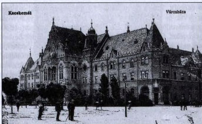
Kecskemét, új városháza (képeslap, 20. sz. eleje)

Kecskemét mezőváros életében a városi tanácsnak, majd vele együtt a választott közösségnek mennyire szerteágazó igazgatási feladatot kellett ellátnia. A tisztségviselők és a városi alkalmazottak magas száma egyértelműen jelzi a feladatok sokrétűségét. A röviden ismertetett feladatmegosztás minden egyes tisztségviselőnél tetemes munkát jelöl meg, sokszor az egyes részfeladatokhoz segítők, beosztottakat is rendelve. Amikor kétszáz év távlatából a szemlélődő ítéletet mond az újkori feudális városi igazgatásról, elmondhatja, hogy a vizsgált kor embere nagy szakértelemmel és érzékkel bírta a városi élet minél színvonalasabbá tételében gazdasági, igazgatási és szociális téren egyaránt.