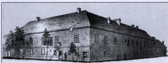
Kecskemét, régi városháza (épült 1746-ban)

vekedett igazgatási feladatok ellátásában segítette a szűkebb testület munkáját.