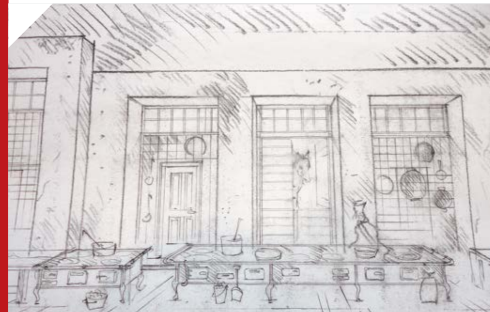
díszletterv: Menczel Róbert

kertben. A dolog arról szól, hogy hogyan képzelem el egy nem túl intelligens réteg azt, miképp néz ki ma egy arisztokrata, egy úr.