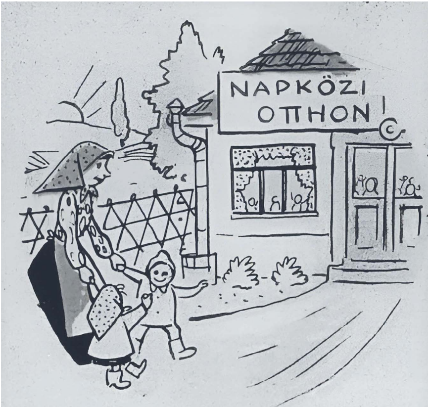
4. kép. „Ma csoporttag, s míg dolgozik, nincs gondja a gyerekre, Napköziben rá van bízva hozzáértő kezekre.” 57

Az egykori propaganda kedvelt eszköze volt a jelen szembeállítása a múlttal, amikor a korábbi rendszer hibáinak felnagyítása felerősítette a fennálló rendszer eredményeit, a szocializmus felsőbbrendűségét.