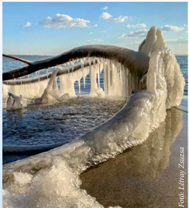
Fotó: Létray Zsuzsa