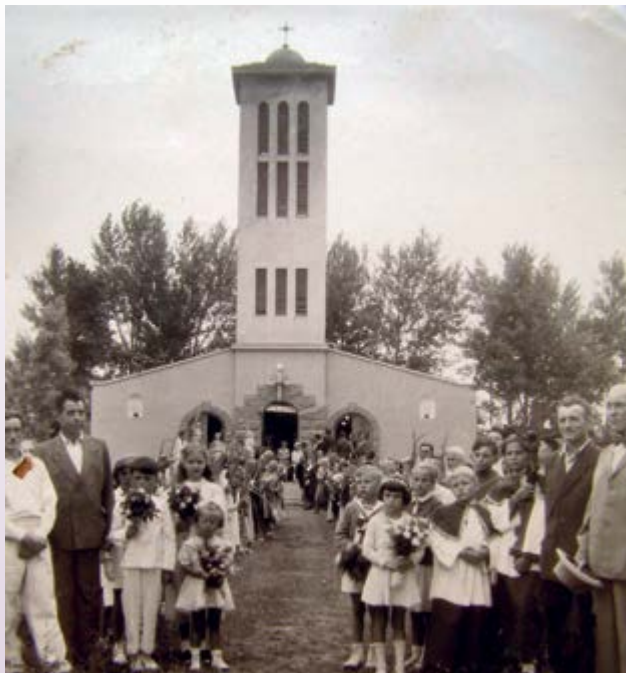
Elsőáldozók 1964 táján