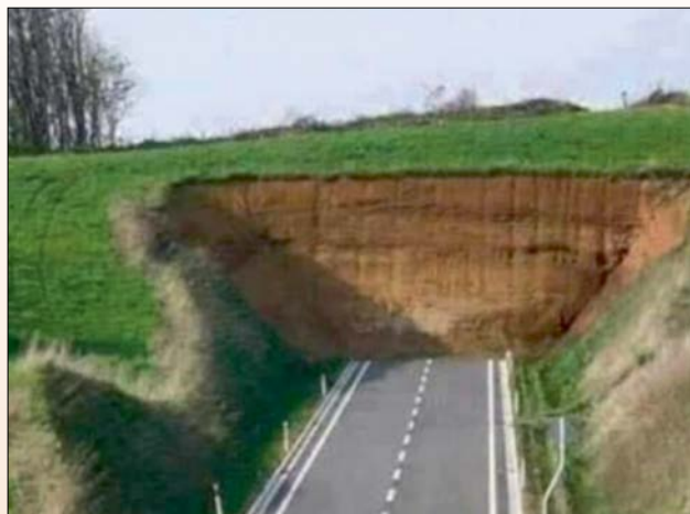
Állítólag, ezen a környéken sokan megfordulnak