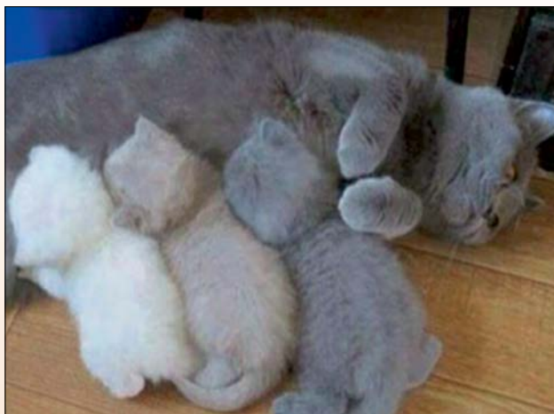
Fogyóban a tintapatron?