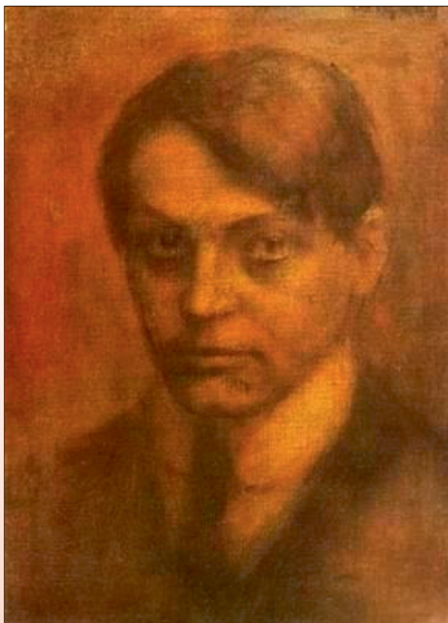
Czigány Dezső: Ady Endre

A Léda-szerelem kilenc évéből - egyre gyérülőbb és rövidebb időszakokban - Ady közel három