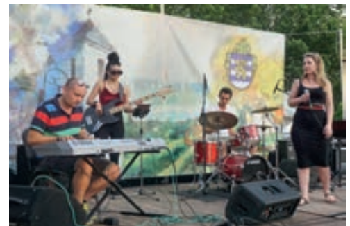
Csupak Demizson Allstars Orchestra fellépése

A Pannon Pálinka Napok második napját Csupak Önkormányzat Községi Borversenyének díjátadója nyitotta meg. Az eseményt a Csupak Demizson Allstars Orchestra vezette fel, amit természetesen hamisíthatlan latin koncert követett. A kisszínpadon a Péter és Pán gitárduó zenéje kísérte az esti pálinkázást és borozást könnyűzenei klasszikusok megidézésével.