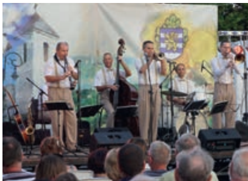
Hot Jazz Band fellépése

nem a kürtöskalácstól a marha hamburgerig számtalan finomságot kóstolhattak meg a látogatók.