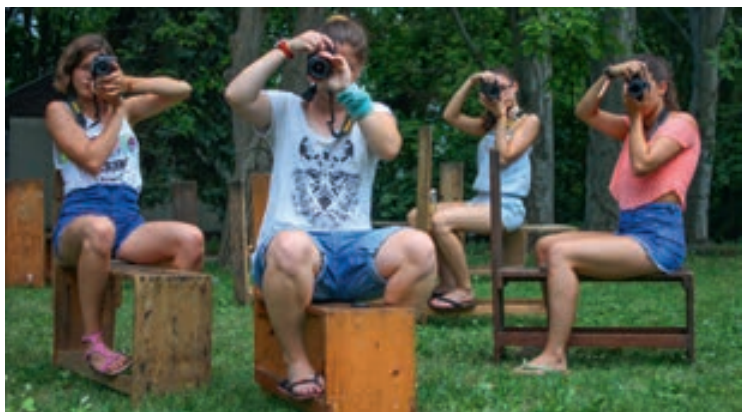
Csupak Művésztelep résztvevői munka közben

A Csupak Művésztelep alkotótáborra 2019. július 21-től 30-ig kerül megrendezésre, melyen az érdeklődő amatőr és főiskolára készülő fiatalok rajzolás, festés, képgrafika, tervezőgrafika, divattervezés, képregény és intermédiák szakokon alkotnak. A tábor záróeseménye az elkészült művekből rendezett kiállítás megnyitója a Csupak Galériában 2019. július 30-án 16 órakor. A kiállítási tárgyakat Gönczi Gábor, műsorvezető fogja játékonysági aukció keretében árverésre bocsátani, mellyel a Magyar Ökumenikus Segélyszervezet munkáját támogatják. A kiállítás megtekinthető 2019. augusztus 11-éig.