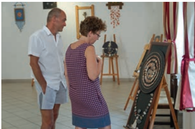
Ízelítő a kiállítási tárgyakból

Csopak Község Önkormányzata nevében az alábbiak szerint tájékoztatom a lakosságot a 2019. évi iskolakezdési támogatással kapcsolatosan: