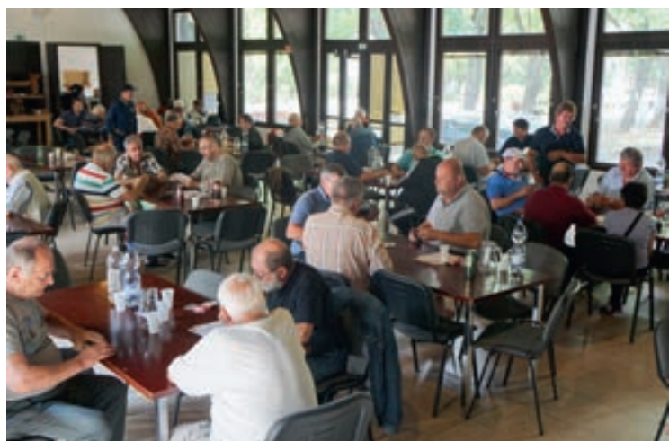
A Parti Ulti Party 49 játékosa

Csopak Község Onkormányzata a hagyományoknak megfelelően ismét megrendezte nyílt ulti-versenyét 2019. július 13-án, szombaton a Csopaki Üdülőfalu és Kemping rendezvénytermében. A 49 regisztrált résztvevő 10 órától a Magyar Ultisok Országos Egyesülete (MUOE) játékszabályai szerint játszott. A délelőtti körök után babgulyás várta a versenyzőket, a játszmák végére pedig az alábbi eredmény alakult ki: