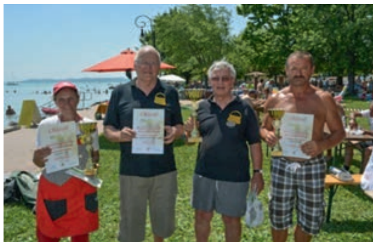
A halászléfőző verseny helyezettei

A meghívásos versenyekre az idei évben hat főzőcsapat mérte össze tudását, egyenként 4-4 fővel, a halfogó versenyen pedig 4 csapat versengett 3-3 fővel.