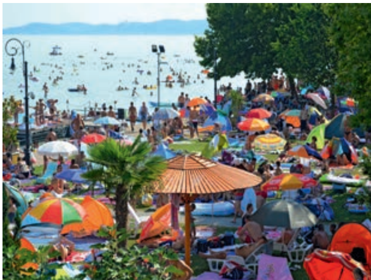
Május utolsó hétvégén megnyitotta kapuit a csopaki strand

A szülőknek és az újszülöttnek jó egészséget, sok örömet kívánunk!