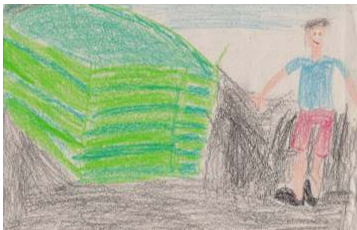
Zsebe Kornél rajza