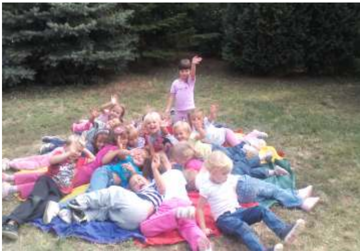
Munka után édes a pihenés...