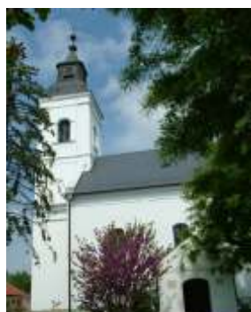
A református templom adott otthont a rendezvénynek