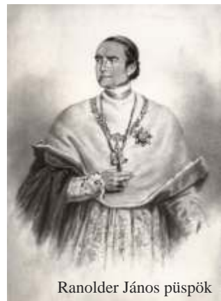
Ranolder János püspök