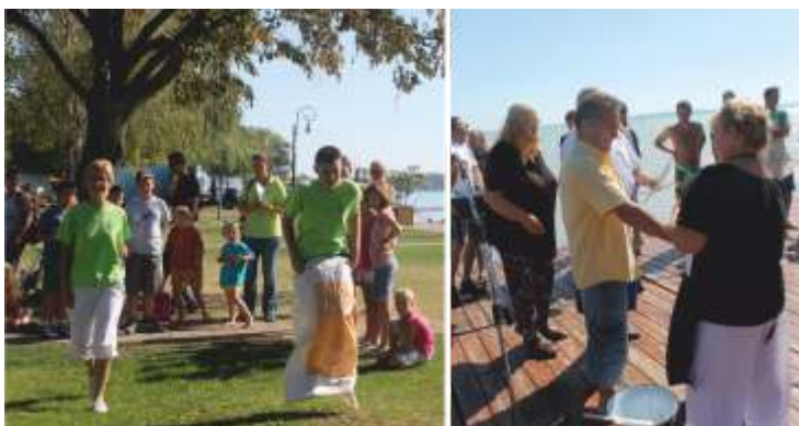
Népszerű ek voltak a sport- és gasztroprogramok