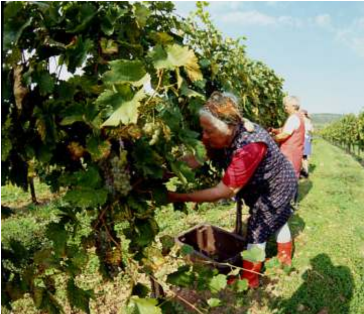
2012-ben a vártnál korábban fejez ttek be a szüreti munkák