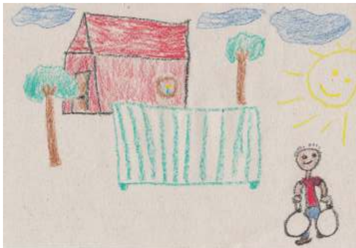
Steinhausz Gergő alkotása