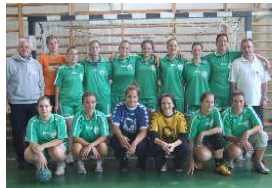
A Csopak SC női kézilabda csapata a 2012/13-as szezonban