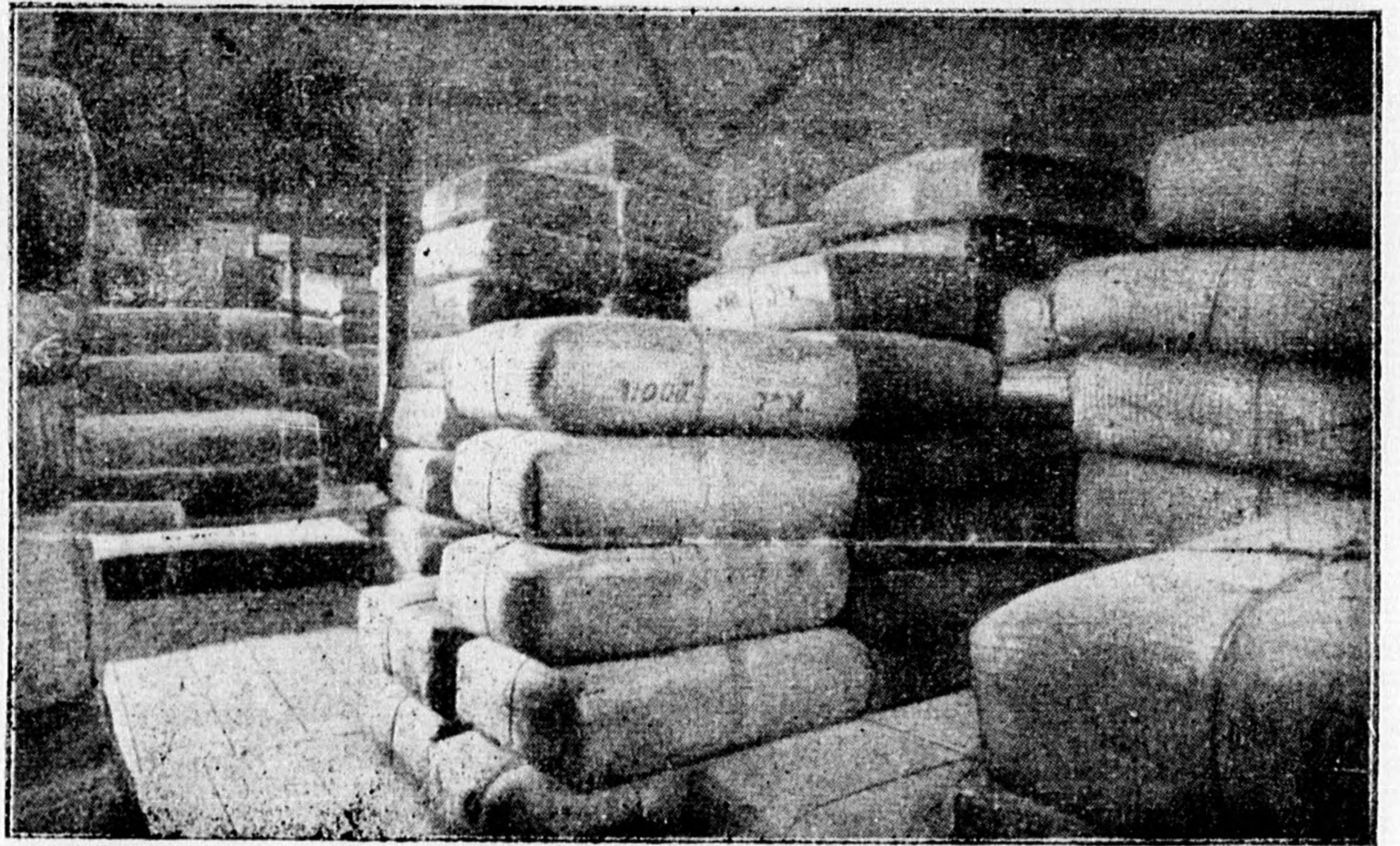
Rinn és Closs heuchelheimi dohánygyárának nyers-dohányraktára