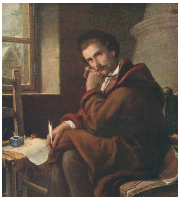
Orlay Petrich Soma /festmény/

„Ej, mi a kő! tyúkanyó, kend A szobában lakik itt bent? Lám, csak jó az isten, jót ád, Hogy fölvitte a kend dolgát!”