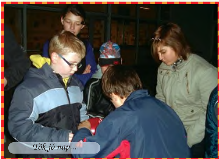
Tök jó nap...