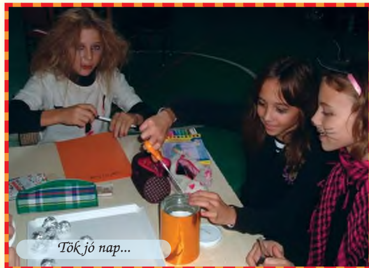
Tök jó nap...