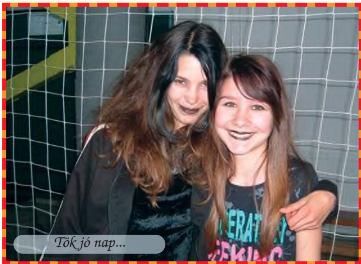
Tök jó nap...